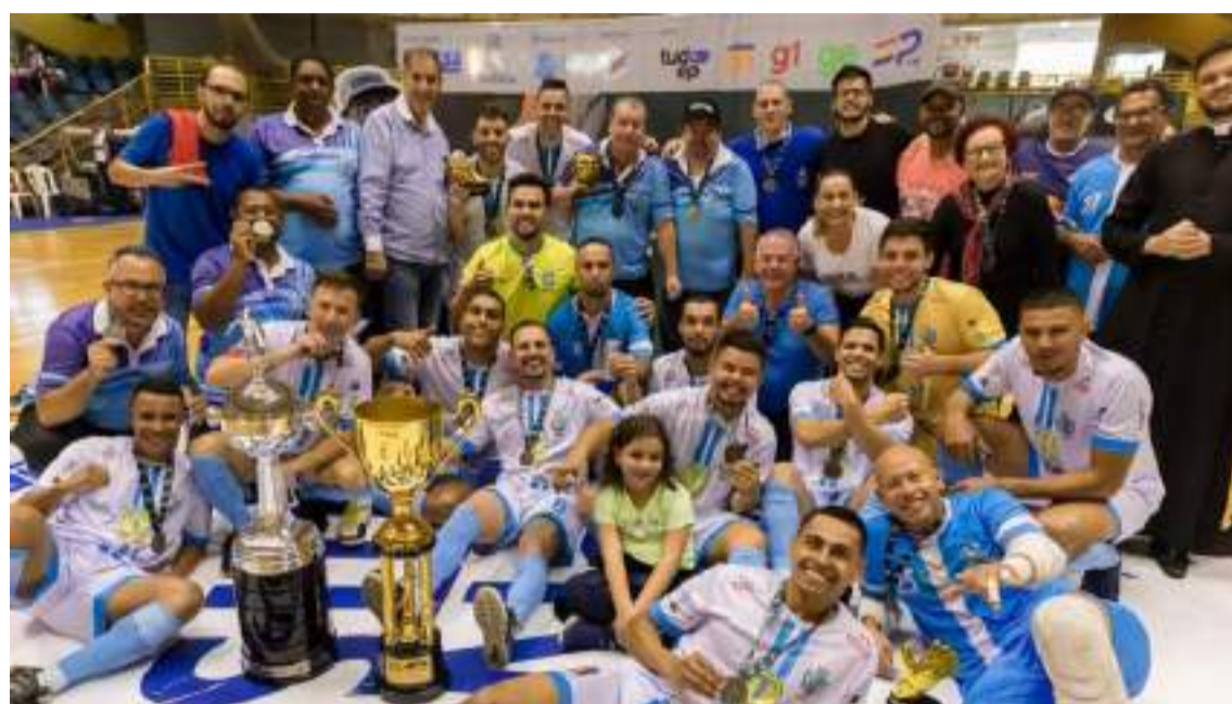
O time campeão de 2023: em busca do sexto título para o "Morro Pelado"

Lançada em 1985, a Taça EPTV de Futsal promove há 39 anos uma união entre esporte e responsabilidade social nas regiões Central, Sul de Minas e de Ribeirão