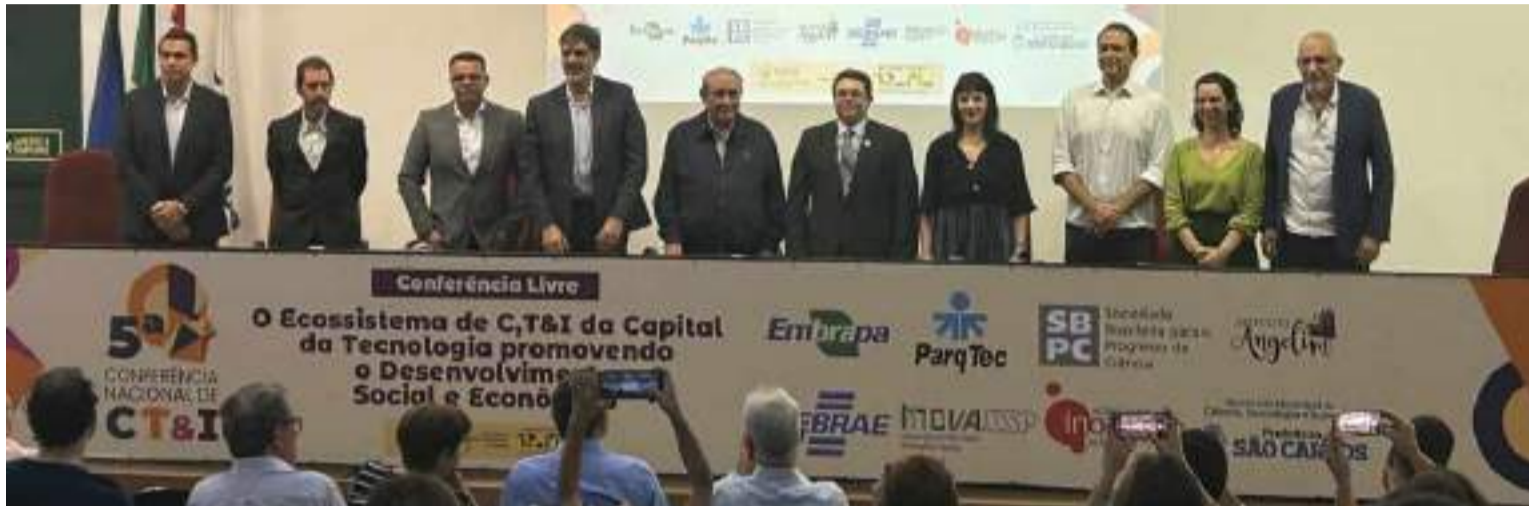
Debate: as lideranças das entidades voltadas para a geração de conhecimento traçam metas ambiciosas para o futuro de São Carlos

Debates preparam município para se apresentar como “cidade laboratório” na Conferência Nacional em Brasília no mês de junho