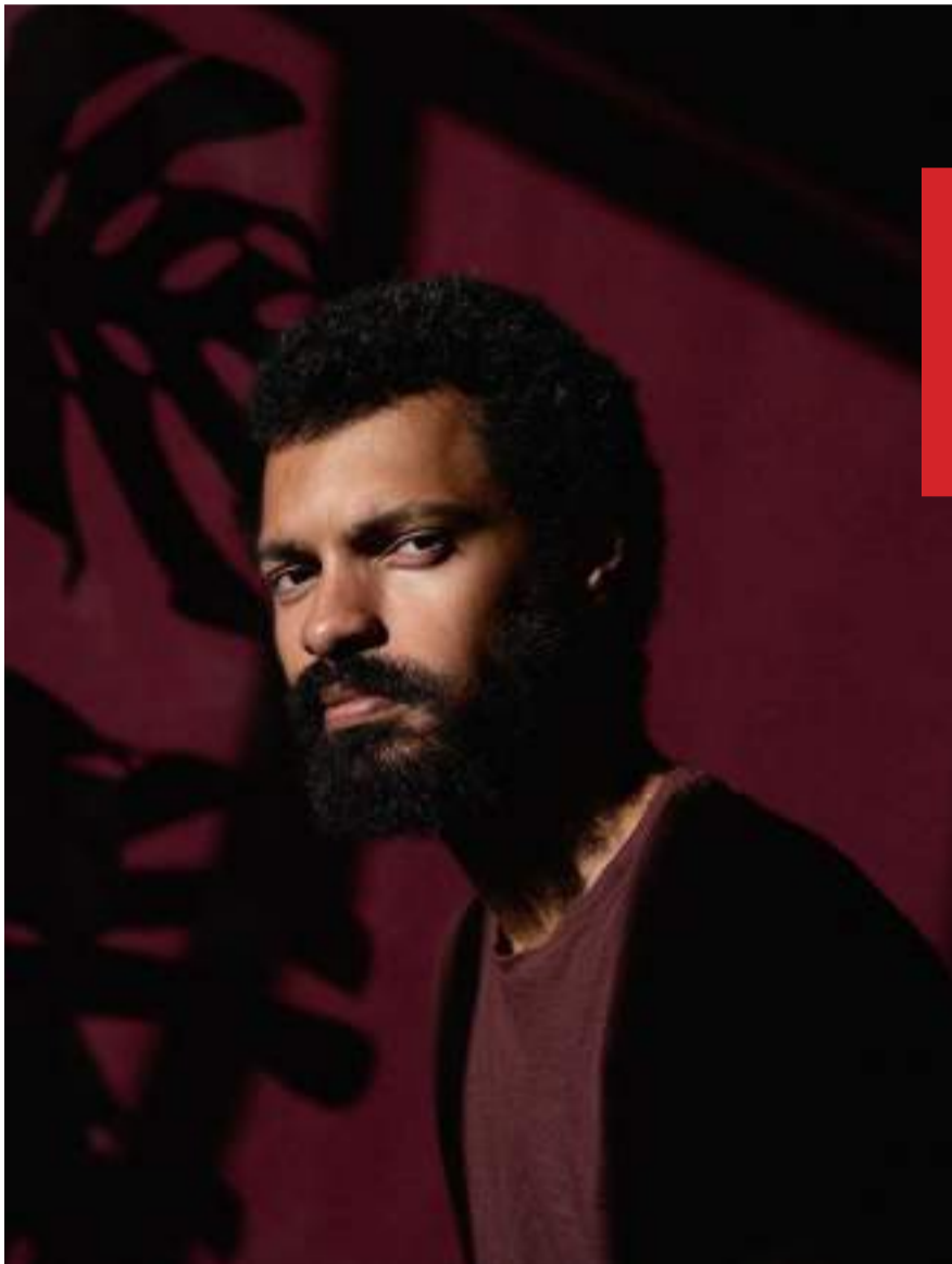
Romance “O Embranquecimento” foi escrito por Evandro Cruz Silva

“O Embranquecimento” acompanha a jornada de Macária, uma intelectual que se vê dividida entre suas raízes humildes e o ambiente acadêmico que agora habita. Filha de uma mãe negra e um pai branco, Macária se torna fascinada pela figura intrigante de Modesto Brocos, um pintor do século XIX cujas obras icônicas refletem o ideal brasileiro de embranquecimento racial.