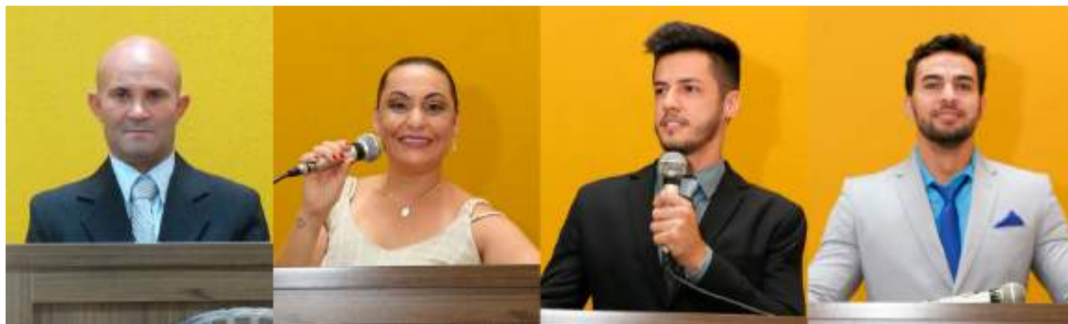
Os vereadores que eram tucanos agora no PSD formam uma bancada com 4 vereadores, mantendo a condição de maior do parlamento

Quarteto governista abandona ninho tucano e voa para partido da prefeita Dona Graça