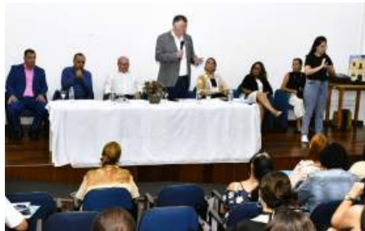
A mesa principal formada para debater temas ligados à acessibilidade dos PCDs