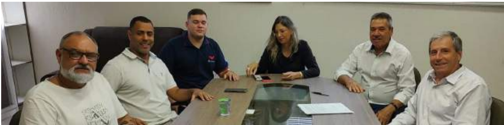
Representantes do Sicoob Crediacisc e Sincomerciários

O Sindicato dos Empregados no Comércio de São Carlos e Região (Sincomerciários) e Sicoob Crediacisc firmaram parceria que irá beneficiar os trabalhadores do comércio e os consumidores em geral.