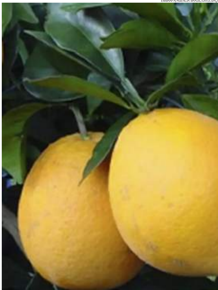
Araraquara e Matão, na Região Central, são dois dos grandes produtores mundiais de laranja e seus derivados

A Região Administrativa de Marília fechou 2023 com crescimento de 0% ante 2022. AS demais regiões apresentaram recuo no PIB. A Região Administrativa de Araçatuba teve uma queda de -0,6% em 2023, a Região Administrativa de Ribeirão Preto teve