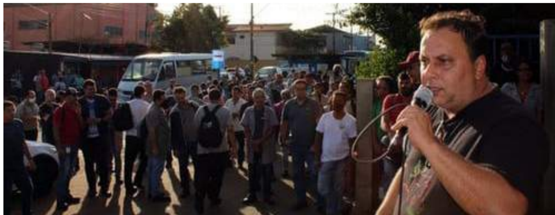
Trabalhadores metalúrgicos: Nos últimos anos, centenas de acordos foram fechados e diversos avanços foram garantidos

O Sindicato dos Metalúrgicos de São Carlos e Ibaté vai realizar, no próximo domingo, 28 de abril, uma Assembleia Geral a partir das 9h30 no Clube de Campo para o lançamento da Campanha Salarial 2024. As negociações, buscando o fechamento dos acordos com reajustes inflacionários e aumentos reais de salários, interessam a cerca de 13.000 trabalhadores metalúrgicos que atuam nas 300 empresas do setor, desde multinacionais, como Tecumseh, Volkswagen e Electrolux, até pequenas usinagens e outras empresas da área.