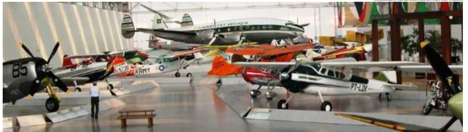
ASSESSORIA/IMPRESA/PREFEITURA SÃO CARLOS

Prefeitura garante que quando LATAM nasceu, foi firmado contrato que garante permanência do museu em São Carlos por mais 40 anos