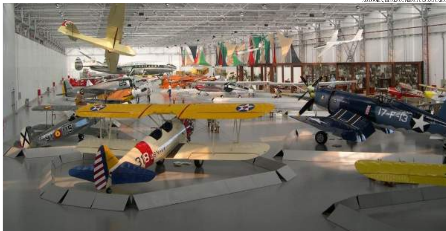
Acervo aeronáutico está em um espaço de 25 mil metros quadrados da companhia LATAM