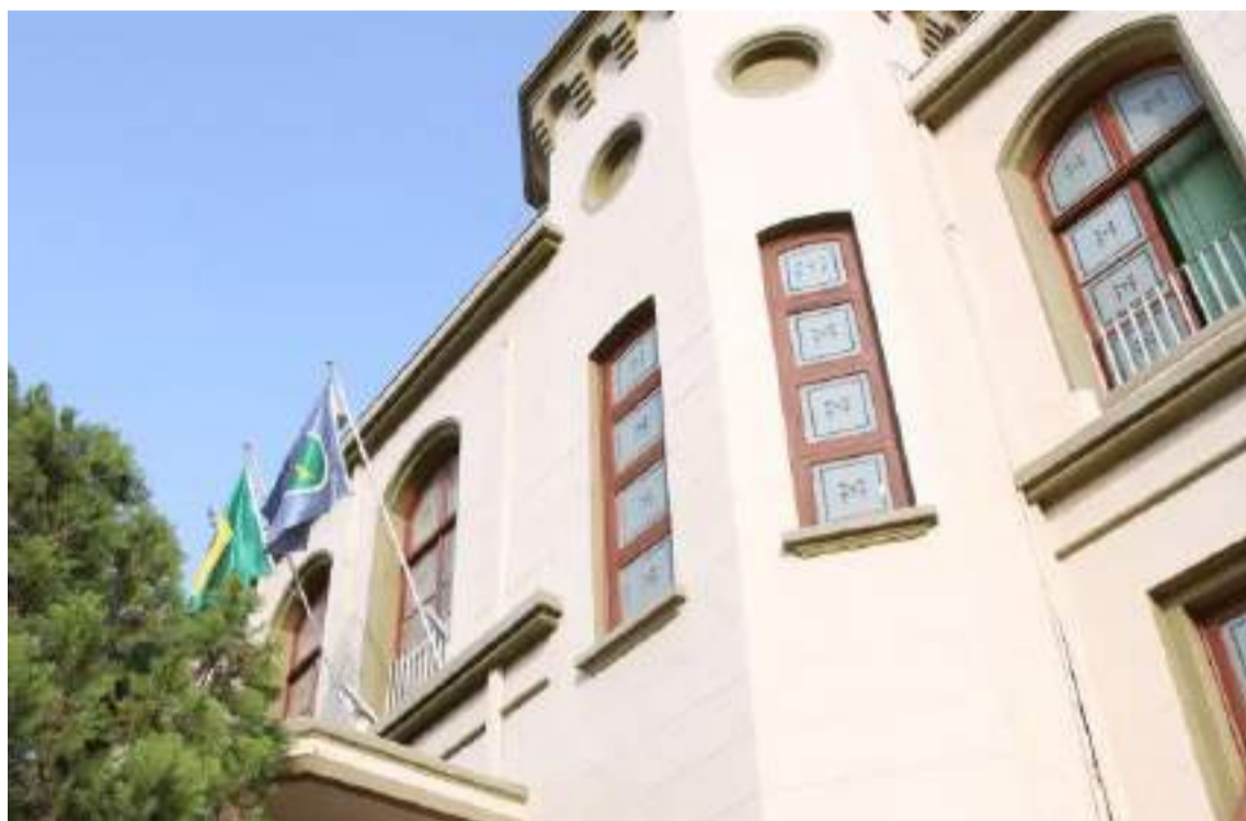
Em 2024, a expectativa é que lideranças evangélicas apresentem suas candidaturas e possam conquistar mais cadeiras na Câmara

Segundo pesquisa realizada pelo Centro de Estudos da Metrópole (CEM/Cepid) da Universidade de São Paulo (USP), de 17.033 tempos evangélicos, em 1990, o Brasil passou a contar com 109.560, em 2019, o que configura um aumento de 543%.