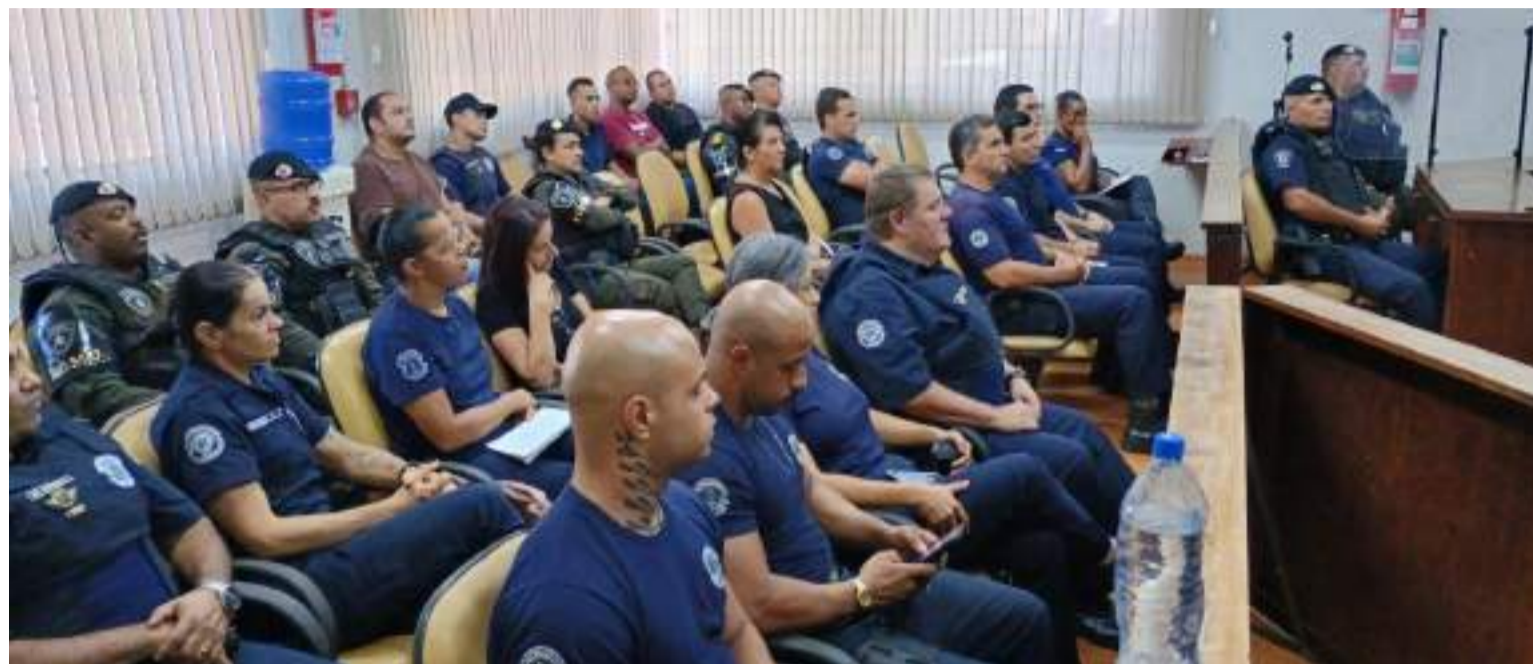
Os guardas municipais ibateenses se qualificando cada vez mais para atuar na segurança

A escolha desse tema não foi por acaso. Em um país onde a segurança pública é constantemente debatida, é crucial que os profissionais responsáveis pela aplicação da lei estejam devidamente preparados para lidar com uma diversidade de cenários, especialmente aqueles que envolvem interações com o público. A doutrina policial, como base filosófica e técnica das ações policiais, fornece os princípios orientadores necessários para garantir uma atuação justa e equilibrada.