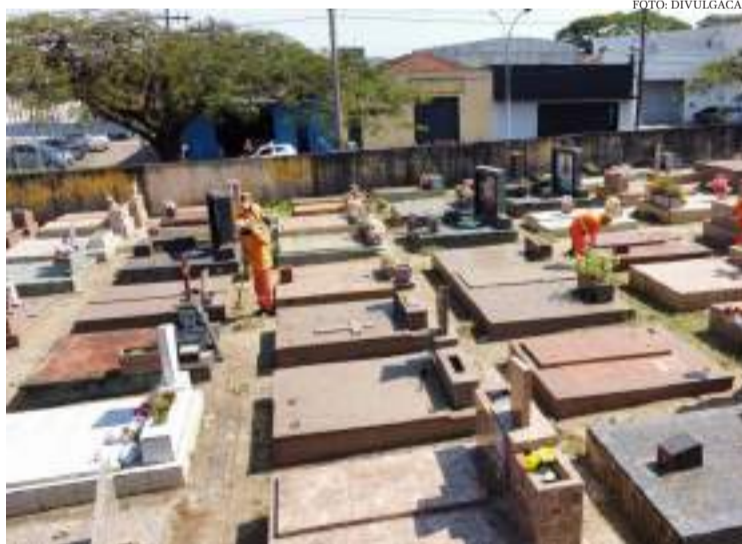
A limpeza de túmulos está autorizada até sexta-feira (10/05)