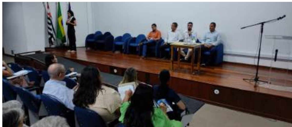
Em 2023 o FUMCAD recebeu cerca de R$ 1,5 milhão com um aumento de 100% na arrecadação

O Fundo financia diversos programas sociais de promoção e proteção dos direitos da criança e do adolescente e este apoio, além de garantir o futuro de milhares de crianças e adolescentes