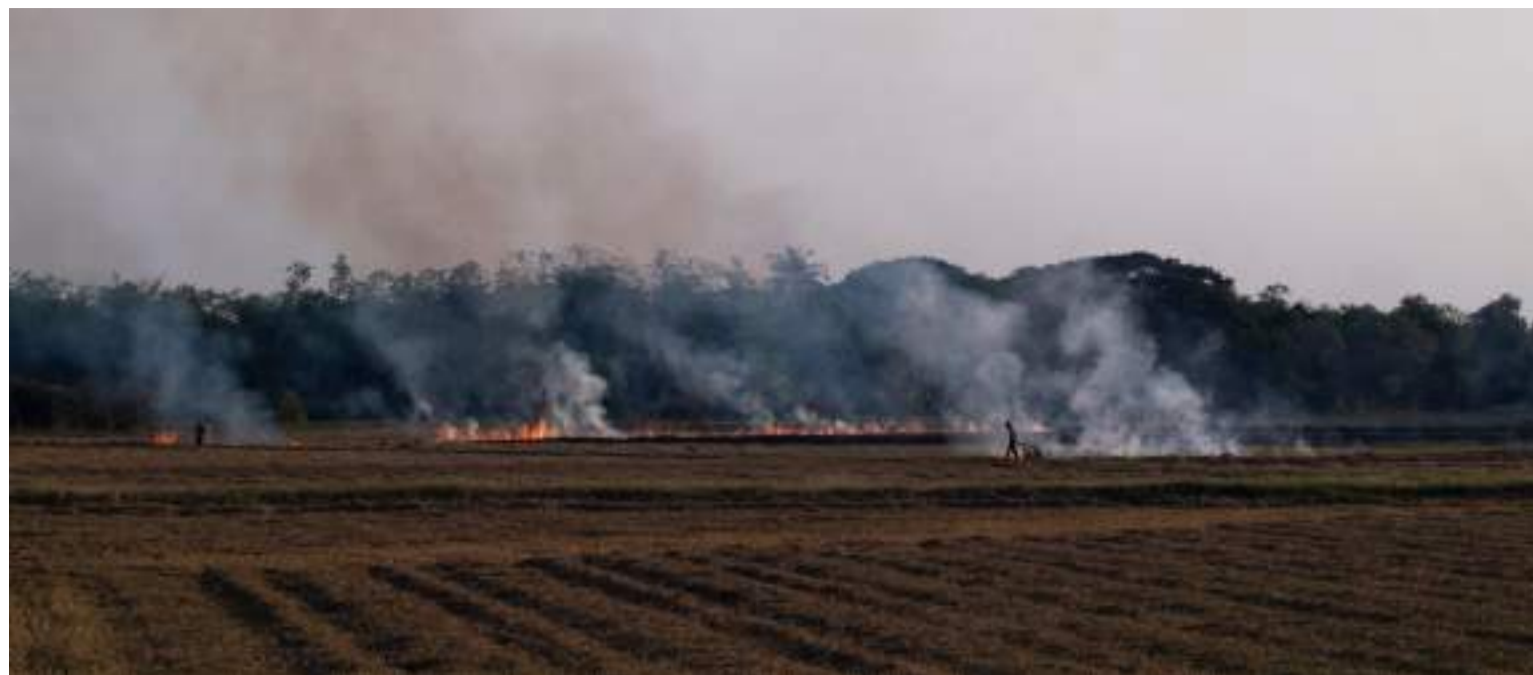
O Promotor de Justiça, Flávio Okamoto, ressalta a importância da participação da população na prevenção de incêndios

Sem controle e com incidência sobre qualquer forma de vegetação, os incêndios, em terrenos, matas ou florestas, prejudicam a vegetação, causam a morte de animais silvestres, aumentam a poluição do ar, diminuem a