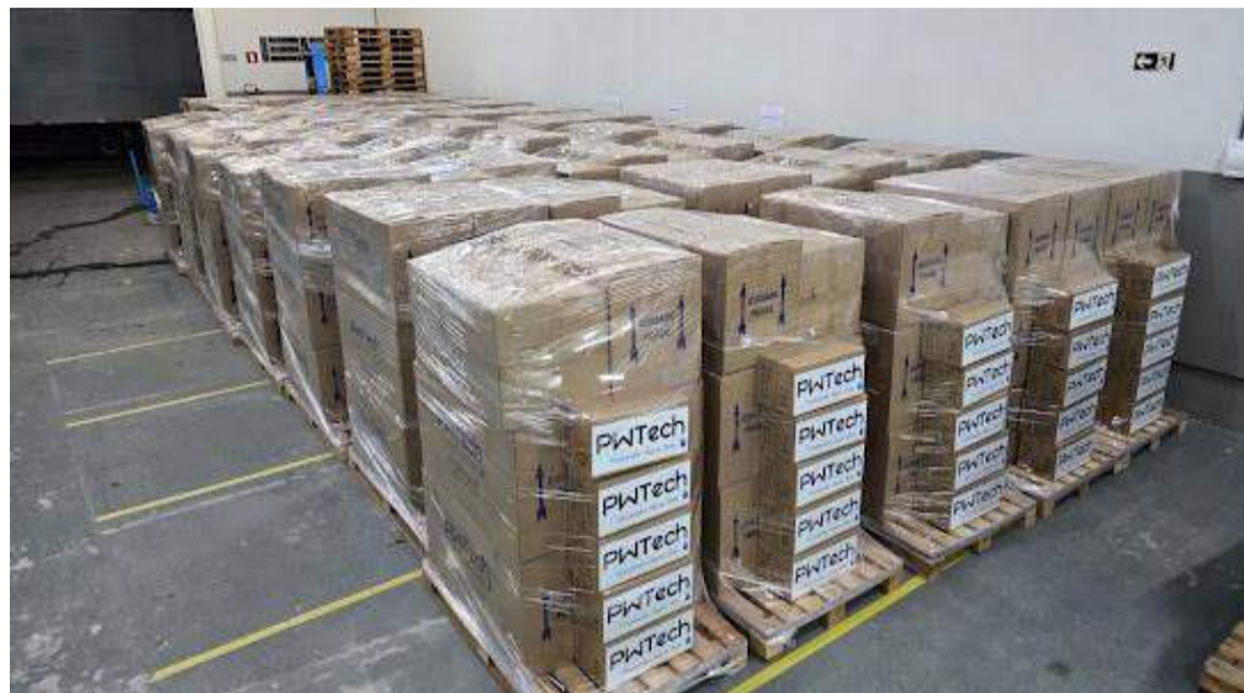
Os purificadores sendo embarcados: O equipamento, que funciona em diferentes fontes de energia, é capaz de purificar de 5.600 litros a 10.000 litros de água por dia

Os 220 purificadores entregues no estado gaúcho têm capacidade de fornecer até 2 milhões de litros de água filtrada por dia, o suficiente para atender 1 milhão de pessoas,