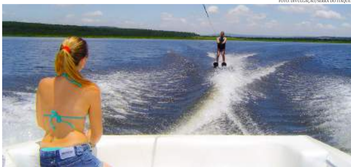
Itirapina: arrecadação tem crescido muito após a implantação da fábrica de automóveis da Honda do Brasil

A previsão da Sefaz-SP é repassar às prefeituras de todo o Estado um montante de R$ 3,4 bilhões a serem arrecadados com o ICMS neste mês de maio.