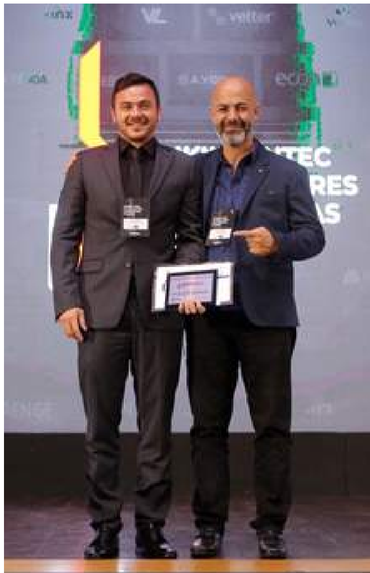
Empresa de São Carlos foi eleita a 33ª maior construtora do Brasil

Empresa de São Carlos recebeu reconhecimento e premiação durante evento em São Paulo