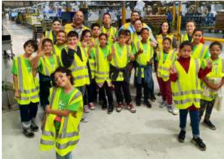
Crianças de escolas de São Carlos visitam a planta da Electrolux e entendem sobre práticas sustentáveis no ambiente industrial