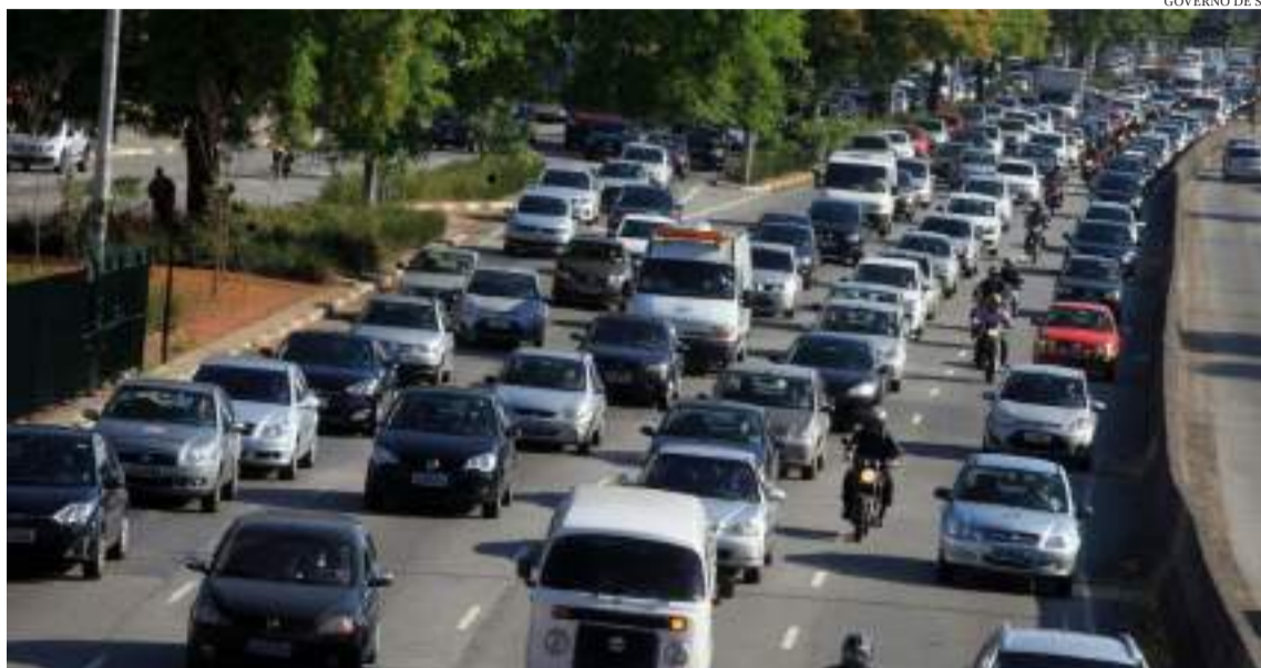
Segundo o Detran-SP, se um veículo não tem mais condições de trafegar, é indicado declará-lo fora de jogo o quanto antes

Hoje, para transferir a propriedade de um veículo – para fazer uma Transferência Digital Veicular (TDV), por exemplo –, uma etapa obrigatória é a realização da vistoria veicular junto a uma empresa credenciada ao órgão de trânsito. Se, ao examinar o automóvel, a ECV encontrar um chassi oxidado, que dificulte a leitura do número, será preciso fazer uma regravação na peça. Caso haja suspeita de adulteração, será necessária uma perícia da Polícia Científica para a regularização