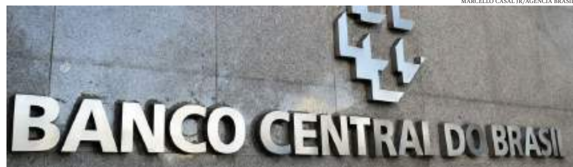
MARCELLO CASAL IR/AGÊNCIA BRASIL

O Comitê de Política Monetária (Copom) alertou que a desancoragem das expectativas de inflação pode levar a um prolongamento do ciclo de alta de juros e que o ritmo de ajustes futuros na Selic será ditado pelo “firme compromisso de convergência da inflação à meta”.