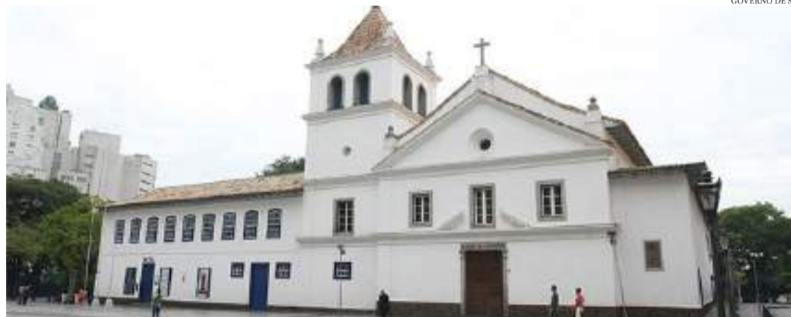
GOVERNO DE SP

"É com muita alegria que celebramos a chegada do Museu das Favelas ao Largo Pátio do Colégio, um lugar estratégico, que facilita o acesso da população ao equipamento cultural, fortalecendo e amplificando tudo o que é produzido pelo