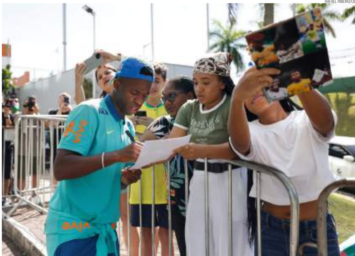
Vinicius Jr. atende os torcedores da Seleção Brasileira no desembarque em Salvador

“Fala, torcida brasileira! Espero que vocês lotem a Fonte Nova, o povo baiano sempre recebe muito bem a Seleção. Tenho certeza de que vai passar muita sorte e energia positiva, para que a gente possa sair de lá com uma grande vitória e espetáculo”, chamou o zagueiro Léo Ortiz.