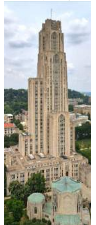
Localizada em Pittsburgh, Pensilvânia, Estados Unidos, a universidade é reconhecida como uma das mais inovadoras do mundo