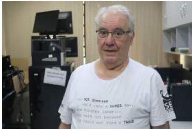
O docente é integrante do Comissão Especial de Banco de Dados (CEBD), da Sociedade Brasileira de Computação (SBC)