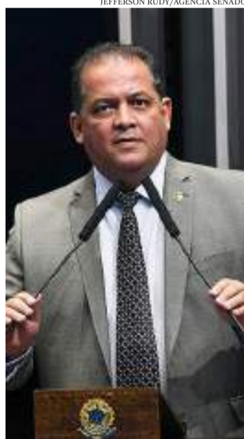
Senador Eduardo Gomes é o relator do projeto

Entre as alterações realizadas no texto, foram introduzidas as chamadas “hipóteses de exceção”