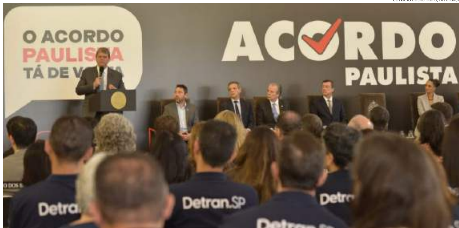
Governador Tarcísio de Freitas durante lançamento do Acordo Paulista