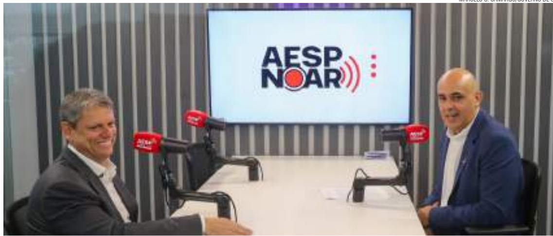
Anúncio foi feito durante inauguração do Estúdio AESP