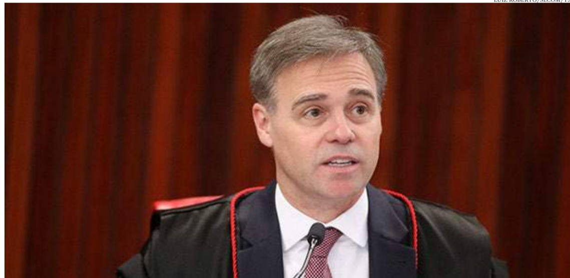
Ministro André Mendonça

O juízo de primeira instância da Justiça Eleitoral julgou