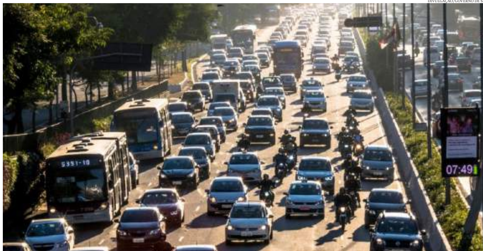
A isenção de IPVA vale também para ônibus ou caminhões movidos exclusivamente a hidrogênio ou gás natural

O benefício contempla ainda outra modalidade: a isenção de IPVA para proprietários de ônibus ou