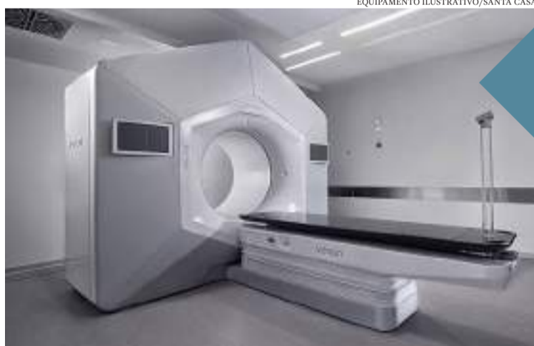
EQUIPAMENTO ILUSTRATIVO/SANTA CASA