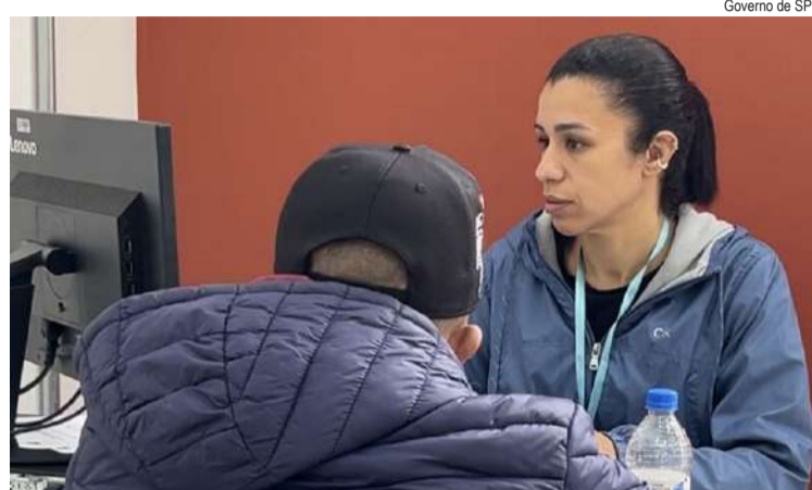
São mais de 1200 unidades no Estado que oferecem acolhida, orientação, atendimento e acompanhamento social às famílias em situação de desproteção social

o Governo do Estado de São Paulo já financiou, de forma integral ou parcial, a instalação de 19 novos Centro de Referência de Assistência Social (CRAS) em 17 municípios: Andradina, Araçatuba, Bauru, Birigui, Buritama, Cafelândia, Cravinhos, Igarapu do Tietê, Itupeva, Santa Branca, Bananal, Ribeirão Preto (duas unidades), Caraguatatuba, Franca (duas unidades), Lençóis Paulista, São Carlos e Tabatinga.