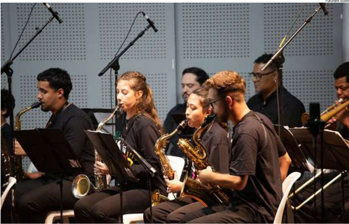
Big Band do GURI São Carlos

Em 2025 o GURI - programa de educação musical da Secretaria da Cultura, Economia e Indústria Criativas do Governo do Estado de São Paulo, gerido pela Santa Marcelina Cultura - celebra 30 anos e a Temporada de Concertos dos 29 Grupos Musicais será especial. Do instrumento ao canto, as formações são as mais diversas. Tem orquestras e bandas sinfônicas, orquestras e cameratas de cordas e de violões, os corais, as big bands, e os grupos de choro, percussão e música instrumental brasileira. Sob a batuta de 40 regentes convidados, as 987 crianças, adolescentes e jovens de até 18 anos, matriculados nos cursos regulares de música do GURI, terão a experiência de se apresentar em público – muitos deles e delas pela primeira vez –, e dividir o palco com diversos artistas. Os estudantes foram previamente selecionados entre março e abril,