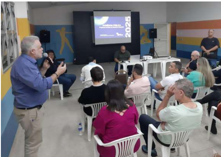
Lineu durante a audiência sobre o Programa de Metas

Atendendo solicitação do vereador, a atual administração fez a publicação do programa, dividido em três pilares: social,