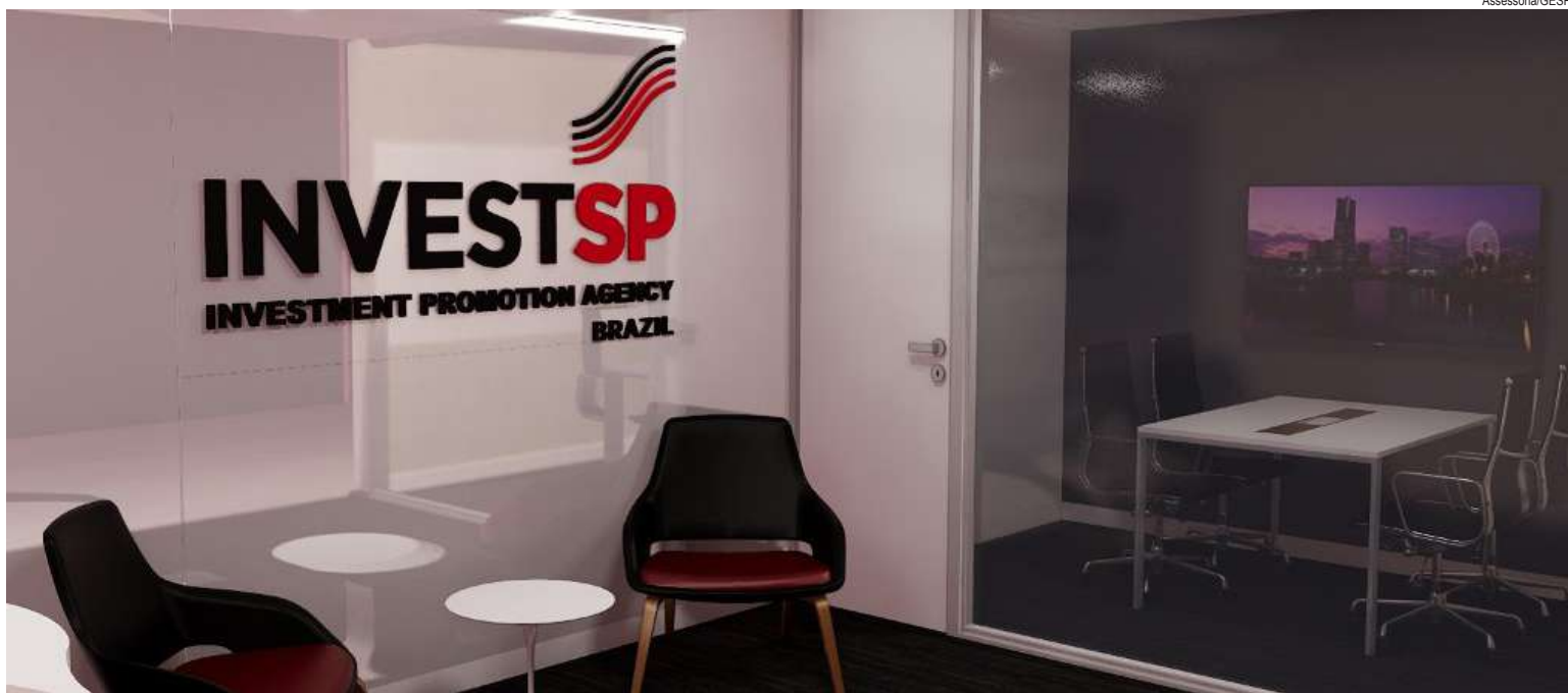
Secretaria de Desenvolvimento Econômico (SDE) de São Paulo mantém um escritório em Xangai, que é administrado pela Agência Paulista de Promoção de Investimentos e Competitividade (Investe SP)