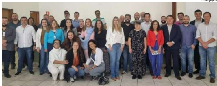
Representantes de nove municípios se reuniram para fortalecer o desenvolvimento turístico na região da Arteac, com apoio do Sebrae-SP

Descalvado recebeu uma visita técnica promovida pela Associação da Região Turística Encantos da Anhanguera Central (Arteac), reunindo representantes dos municípios que integram a entidade para discutir estratégias de fortalecimento do turismo regional. A programação começou com um café da manhã na Associação Comercial e Industrial de Descalvado e seguiu com visitas a atrativos turísticos e empreendimentos locais.