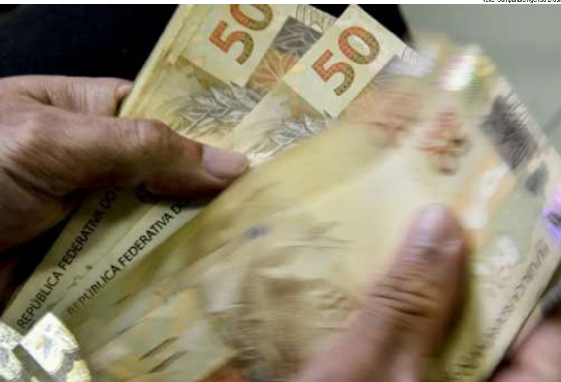
Valter Campanato/Agência Brasil

A medida provisória (MP) que pretende compensar a elevação do Imposto sobre Operações Financeiras (IOF) prevê um corte de gastos obrigatórios de R$ 4,28 bilhões em 2025, divulgou o Ministério da Fazenda. Para 2026, a economia está estimada em R$ 10,69 bilhões. Os números foram compilados pelo Tesouro Nacional.