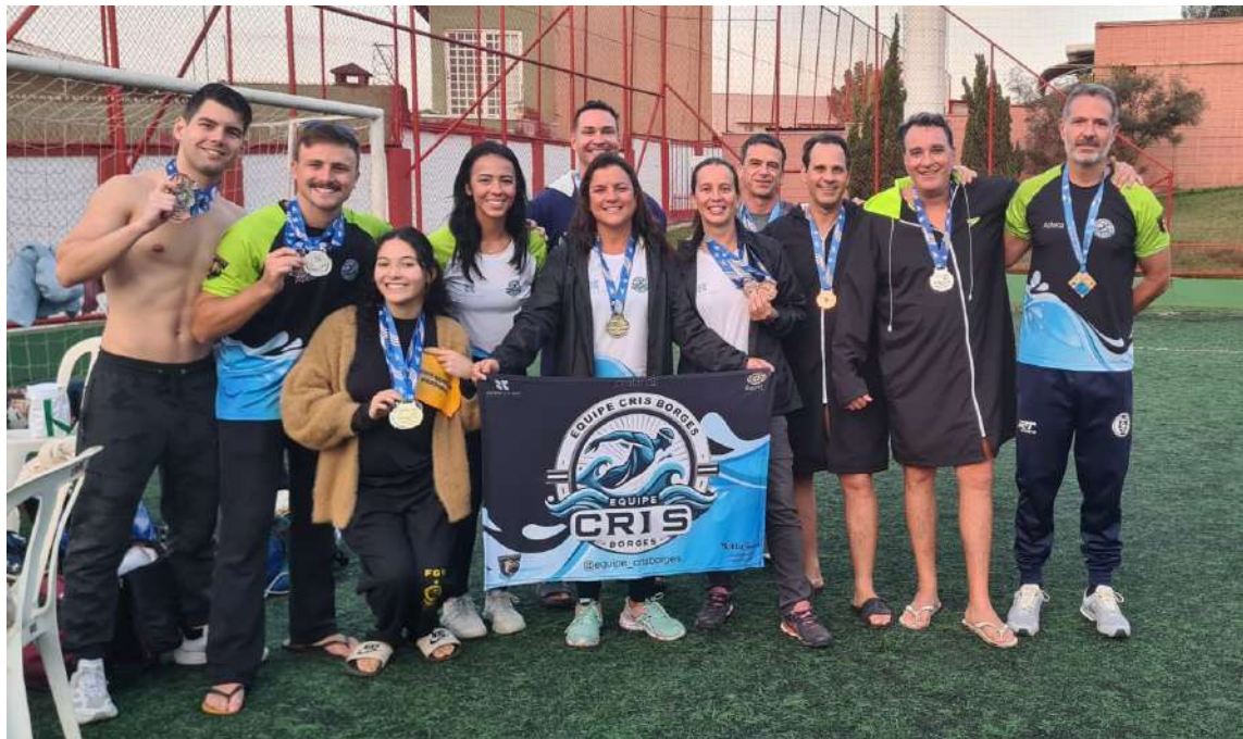
Integrantes da Equipe Cris Borges de São Carlos mostraram a força do esporte amador

Equipe Cris Borges São Carlos conquista prêmios no Campeonato Paulista Master de Inverno em Araras