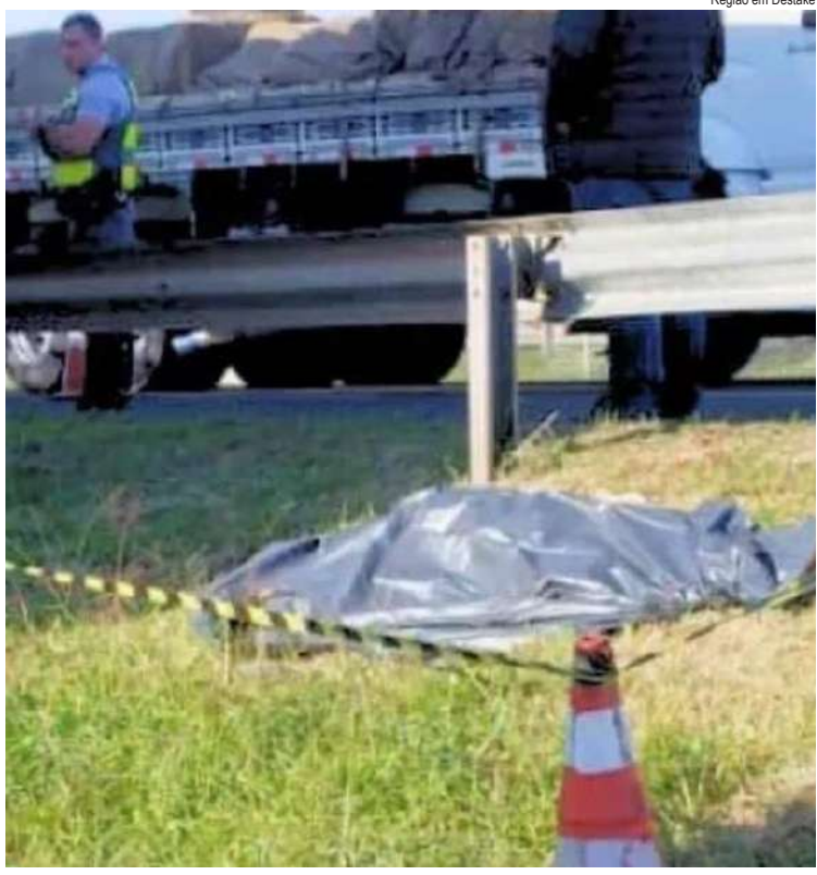
Região em Destaque

A concessionária responsável pela rodovia colaborou com a sinalização e o gerenciamento do tráfego no local. A Polícia Civil abriu inquérito para apurar as circunstâncias do acidente, e a população pode fornecer informações relevantes pelo telefone 190.