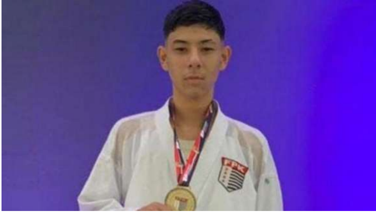
Karatecas são-carlenses prometem empenho e conquistas de medalhas para a cidade