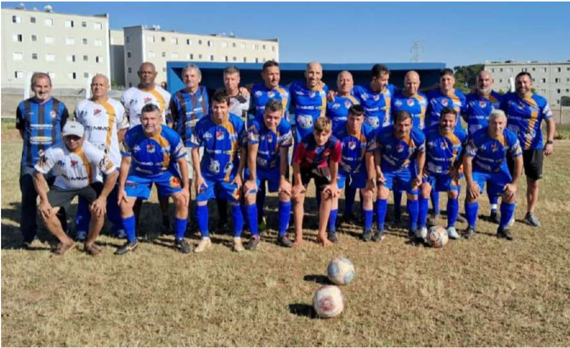
Aliança encara o Bandeirantes em uma das semifinal do Master

Com os “bichos papões” Munique e Dínamo, possuidores das melhores campanhas e surpreendentemente derrotados nas quartas de final, começam neste sábado, 19, as semifinais do Campeonato Master, promovido pela Liga de Futebol Amador de São Carlos. O palco das partidas “de ida”