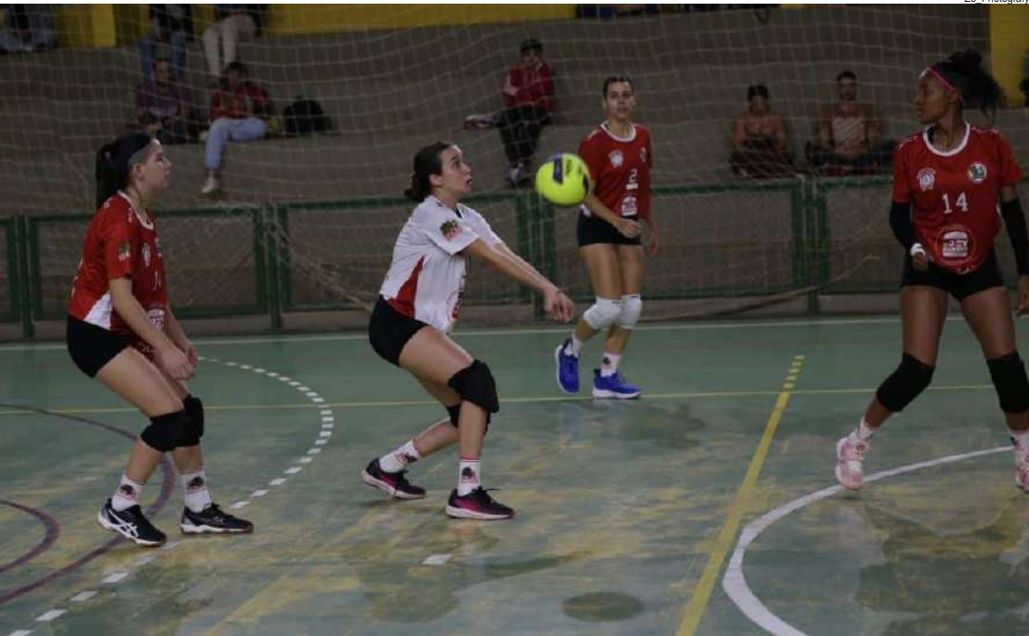
Um jogo bem disputado está previsto para o ginásio de esportes da UFSCar pela Copa AVS/Smec

Já na quinta-feira, 24, no ginásio municipal de esportes Aristeu Favoretto, na Redenção, o Fênix estará em ação novamente e pega o Golden Team, de Américo Brasiliense que também está invicto, mas vez apenas uma apresentação e está em 6º lugar, com 4 pontos. Para os amantes do vôlei, a entrada é gratuita. Classificação Fênix/LBR Sports – 10 pontos AVS – 7 pontos UFSCar – 7 pontos Elite – 4 pontos Caaso – 4 pontos Golden Team – 4 pontos AVS/Fusion – 1 ponto Alpha – 1 ponto Scorpions – 1 ponto Country Club – 1 ponto