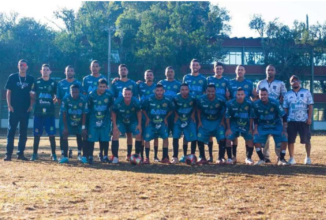
Em um jogo bem disputado, Marola levou a melhor sobre o Deportivo Sanka

Um dia repleto de muito futebol, alimentado por adrenalina, emoção e muita tensão. Assim foi a última rodada da primeira fase da Champions Cup – Série Prata. Foram 14 jogos que definiram as 16 equipes classificadas para a segunda fase. Vários jogos decidiram a sorte das equipes que ainda buscavam a classificação. Por outro lado, outras já classificadas buscavam manter uma boa posição e acrescentar um capítulo a mais na rivalidade esportiva criada ao longo dos anos. Um dos jogos reuniu as equipes Marola Sanka contra o Deportivo Sanka. As duas equipes alimentam uma rivalidade esportiva e desta vez quem levou a melhor foi o Marola que goleou por 4 a 0, gols de Kauan na primeira etapa. Dé, Pablo e Richad completaram o placar com gols na etapa final.