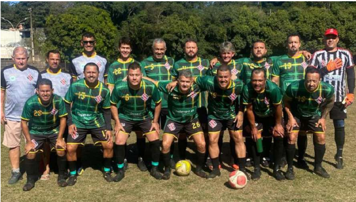
Fortaleza está com a mão na vaga para ser finalista no Master

Dois jogos, previstos para a tarde deste sábado, 26, no campo da UFSCar, irão definir os finalistas do Campeonato Master, promovido pela Liga de Futebol Amador de São Carlos.