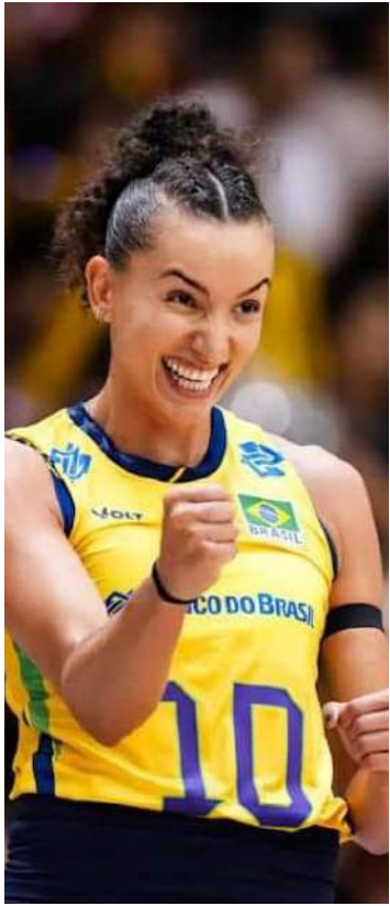
A capitã Gabi, com 12 pontos, foi um dos destaques do Brasil na vitória diante da Alemanha

O primeiro set começou com o Brasil aproveitando a sequência de erros de nervosas alemãs e logo abrindo vantagem de três pontos. O