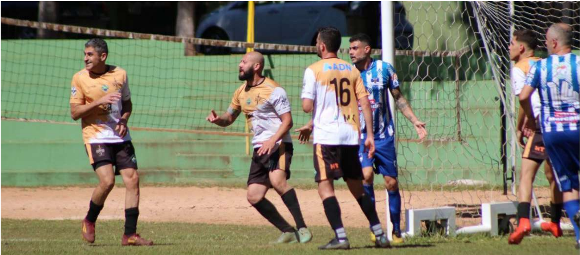
Bons jogos marcaram a última rodada da primeira fase: definidos os semifinalistas

Uma manhã eletrizante, com três jogos válidos pela última rodada da primeira fase do Campeonato Interno de Futebol do Clube Faber Castell. Os jogos foram realizados na manhã deste domingo, 3, no Cedrinho e definiu os semifinalistas do torneio. Após a conclusão da fase, WLM, Loz Bárbaros, Marquesfit e Tenda estão qualificados e continuam em busca do título da temporada 2025.