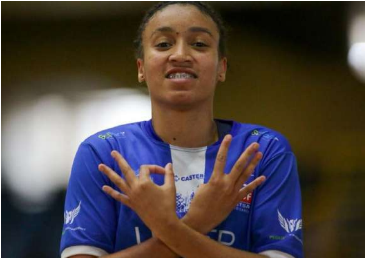
Que vitória: equipe são-carlense fez uma bela apresentação contra as 'brabinhas'

Uma vitória com “V” maiúsculo. Direito a um “baile” e uma goleada. No retorno aos jogos oficiais no segundo semestre, a equipe sub20 ASF/Unicep São Carlos goleou o Corinthians Paulista pelo Campeonato Paulista por 5 a 1.