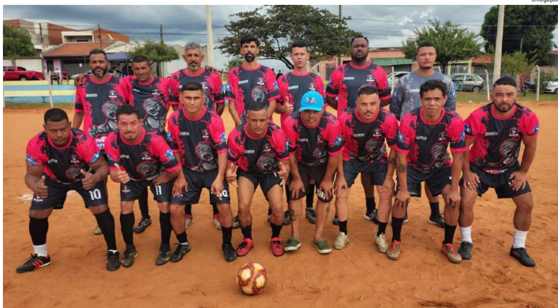
Tijuco Preto tenta surpreender o invicto Família Planalto Verde