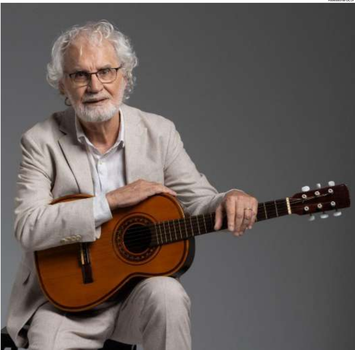
Abertura oficial do evento, no dia 12, traz show do cantor Renato Teixeira no Theatro Municipal