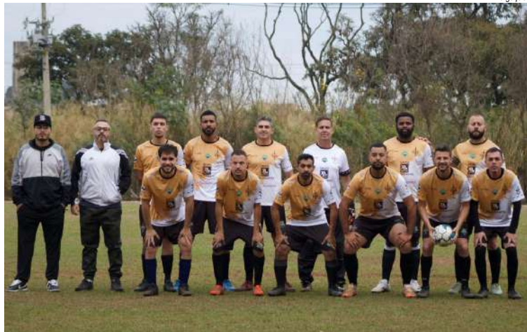
Loz Bárbaros tem uma dura missão: goleiar o WLM para reverter a desvantagem

O Campeonato Interno do Clube Faber Castell, edição 2025, irá definir os finalistas, após a segunda rodada da semifinal, prevista para a manhã deste domingo, 17, no Cedrinho.