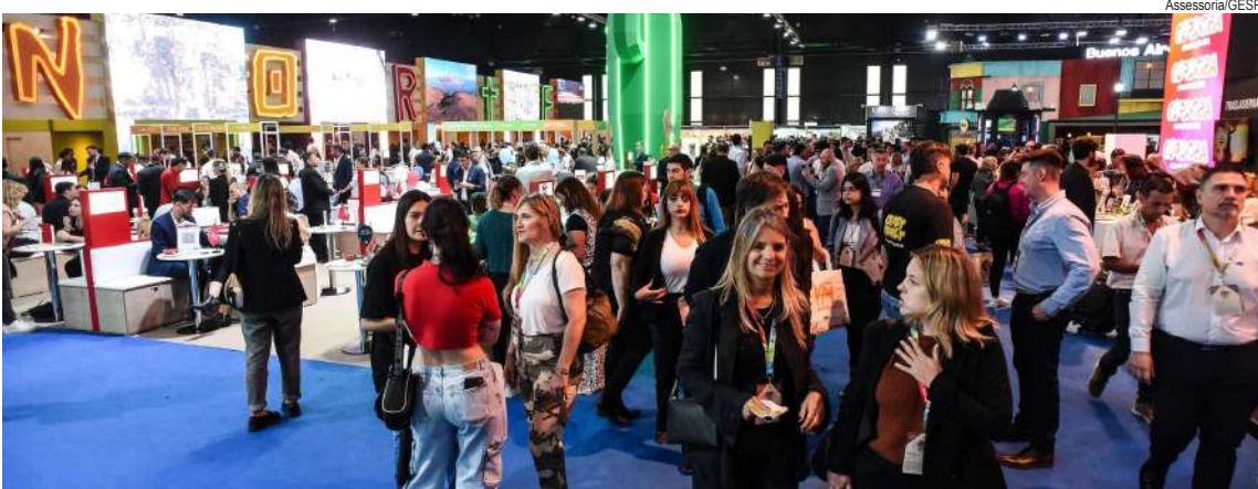
Primeira missão internacional, entre 25 de setembro e 1º de outubro, será para a Feira Internacional de Turismo (FIT) de Buenos Aires, na Argentina

terão acesso a um reembolso de até US$ 3 mil em despesas elegíveis para custear até 50% dos gastos com a viagem, além de eventos de networking e ações de consultoria, monitoramento de resultados e acompanhamento pós-evento.