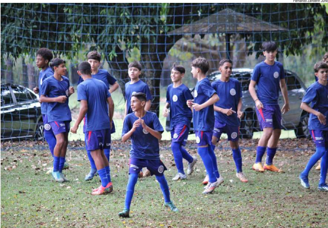
Jogadores do Grêmio treinam para o próximo desafio no Paulista