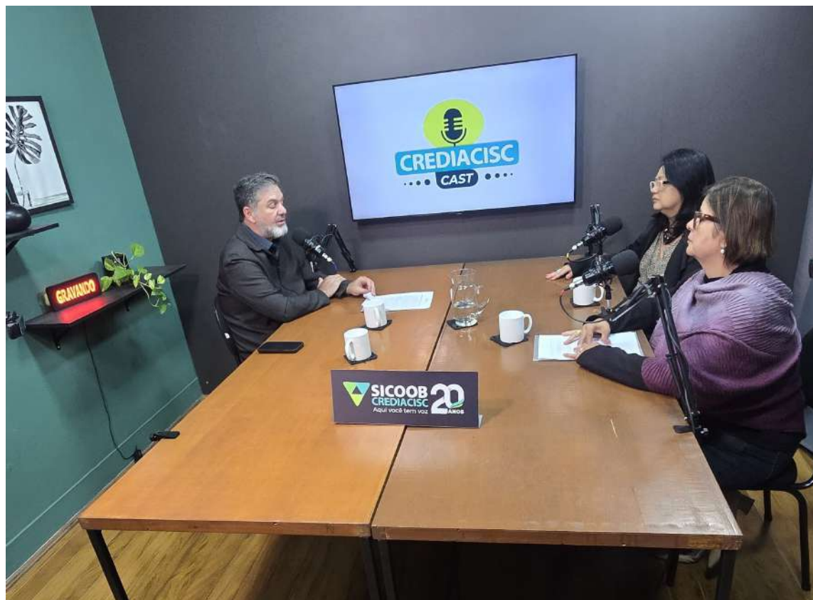
Projeto CorAção gravou videocast do Sicoob Crediacisc

Projeto atende mais de 150 crianças e pelo menos 100 famílias na região do Jardim Zavaglia, em São Carlos