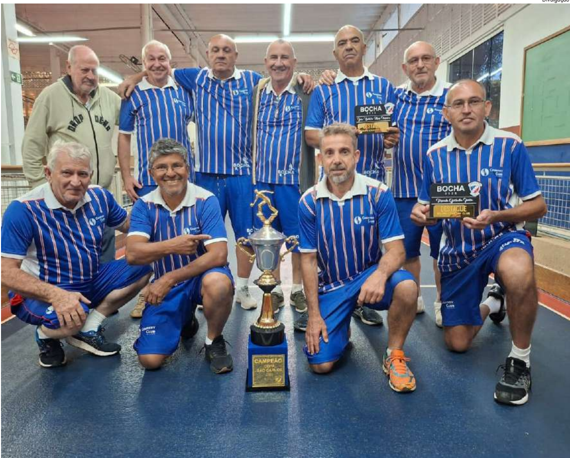
Equipe de bocha do Country garantiu o troféu de campeão

No segundo jogo, às 10h, o WLM Engenharia está com a mão na final. No jogo de ida goleou o Loz Bárbaros por 4 a 0 e pode perder até por três gols de diferença para ser finalista. Já o adversário tem que goleiar por quatro gols para levar a decisão para os pênaltis ou contagem superior para reverter a desvantagem e ser finalista.