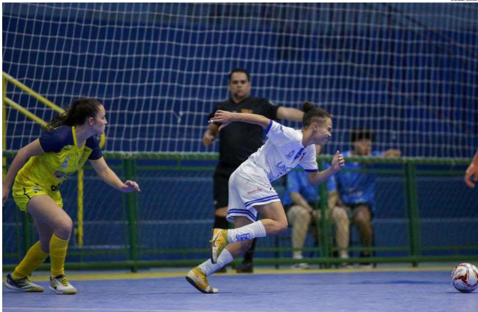
Sub20 joga de olho na reabilitação no Paulista

“A respeito do confronto com o Fênix, é crucial conquistarmos a vitória para que o grupo restabeleça a confiança. Embora não tenhamos apresentado um desempenho insatisfatório contra São José, fomos superadas e é fundamental retomar o caminho das vitórias para que as atletas recuperem a confiança, sobretudo a mental”, disse a treinadora que alertou para o fato de as adversárias terem qualidade e pode complicar a meta da ASF. “O Fênix, como sabemos, é uma equipe que imprime velocidade ao jogo e possui elevada qualidade técnica. Será imperativo dedicarmos atenção redobrada à marcação, especialmente para evitar a concessão de gols e jogadas de tabela, mantendo vigilância constante ao neutralizar os movimentos do adversário. Precisamos impor a nossa estratégia de jogo, fazendo com que o adversário atue de acordo com o que idealizamos para a partida.