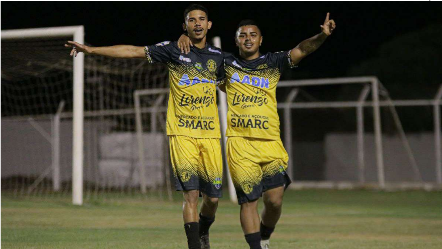
Jogadores do Santa Angelina comemoram gol: vitória valeu entrada no G8

O final de semana promete ser agitado no São Carlos Country Club, com a realização da terceira rodada da fase de classificação do Campeonato Master. Os jogos serão na tarde de sábado, 30 e manhã de domingo, 31.