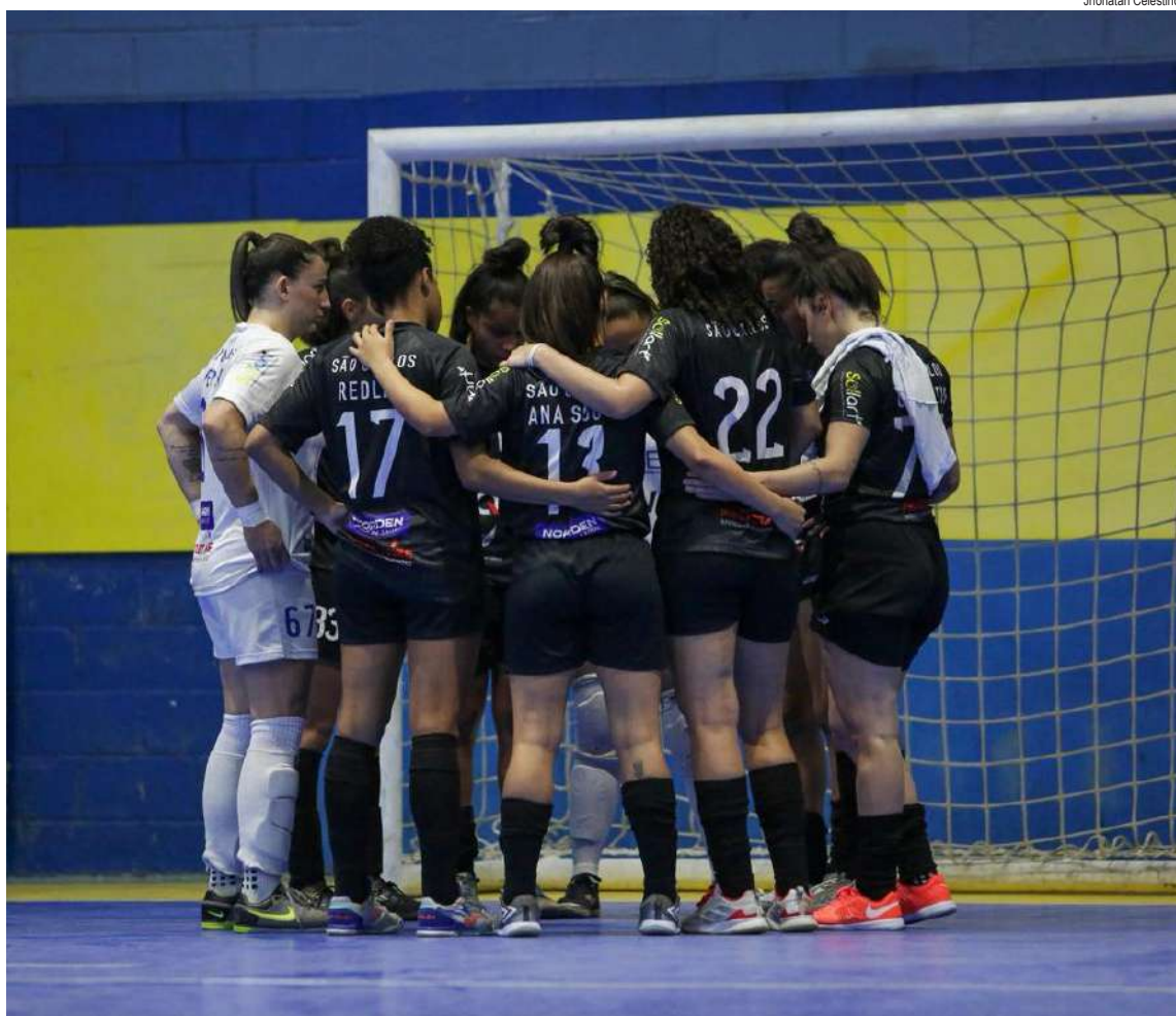
Equipe adulta faz a estreia na LPF e sonha com uma vitória

P aralelamente ao Campeonato Paulista, a equipe adulta de futsal feminino da ASF/Unicep São Carlos inicia sua trajetória no campeonato da LPF e às 19h deste sábado, 30, faz a estreia quando encara a AD Vaz, de Marília, no ginásio municipal de esportes Milton Olaio Filho.