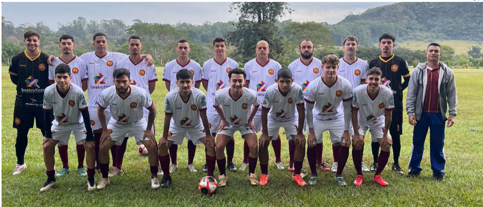
Juventude pega o Milan em briga direta pela classificação na Ouro

8h – Juventude x Milan Ibaté 10h – Pé Na Porta x Atlético Munique Campo da UFSCar 8h – Zé Bebeu x Pakabá 10h – União Douradense x Aracy