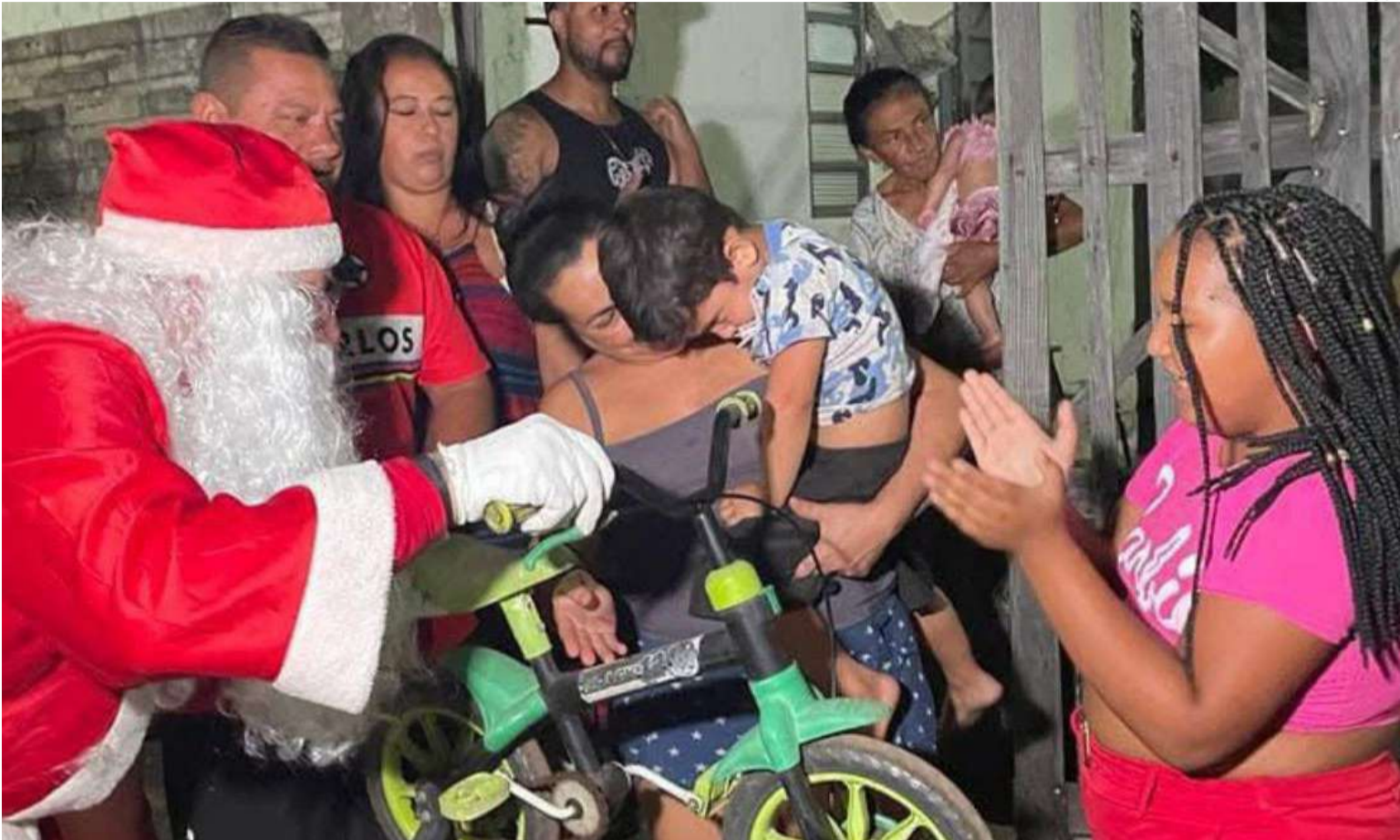
Momento ternura: em 2024, o Papai Noel Ciclista emociona criança carente ao dar uma bicicleta de presente