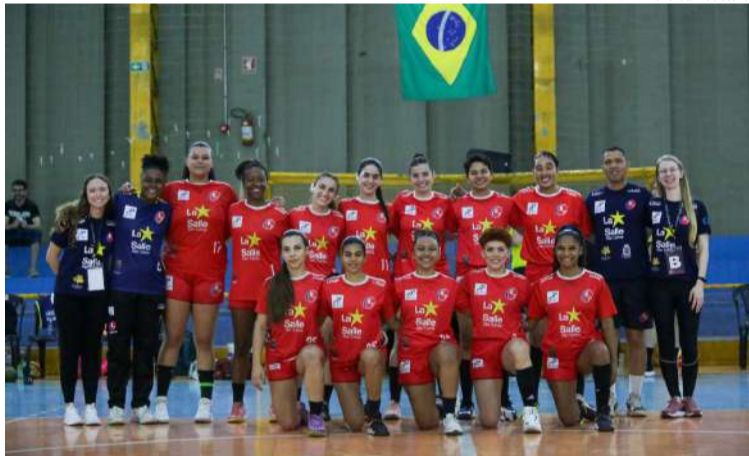
Time são-carlense vai para um dos jogos mais importantes do ano em Praia Grande

Um empate neste domingo, 31, em Praia Grande, será suficiente para que a equipe de handebol feminino H7 Esportes/La Salle conquiste um feito inédito no Campeonato Paulista: ir à semifinal e ficar entre as quatro forças da modalidade no Estado.