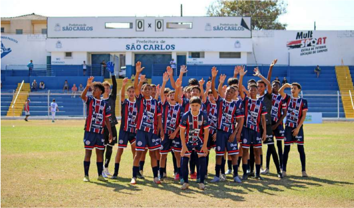
Greminho sub14 tem que vencer para não depender de resultados