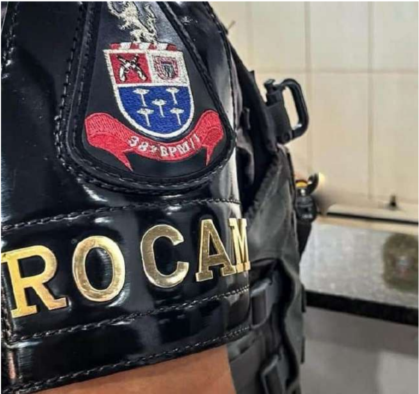
38ª BPM/ São Carlos

A denúncia dava conta que o acusado estaria em uma moradia na rua Mauro Tomase. Após a abordagem, em pesquisa, os policiais apuraram que ele tem uma pena de 11 anos para cumprir. Diante dos fatos, ele foi encaminhado à CPJ e posteriormente recolhido ao centro de triagem.