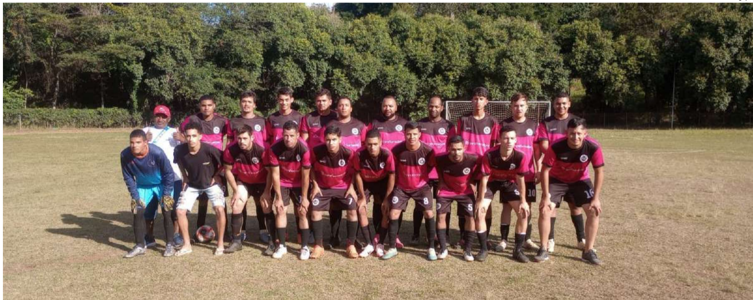
R9 encara o Várzea City e precisa vencer para reverter a vantagem do adversário

A partir de agora, um erro poderá ser fatal e eliminar a equipe.