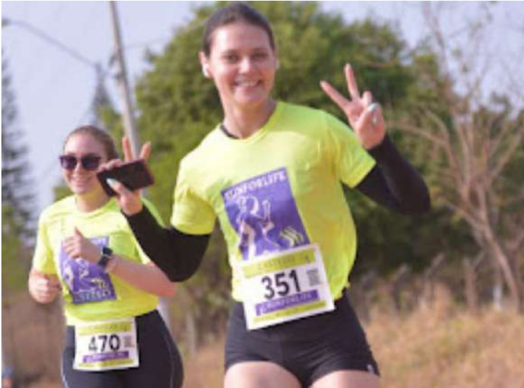
Runforlife, promovido pelo Castelo Plaza, vai agitar o esporte de São Carlos

Corrida deve reunir centenas de atletas e famílias em São Carlos