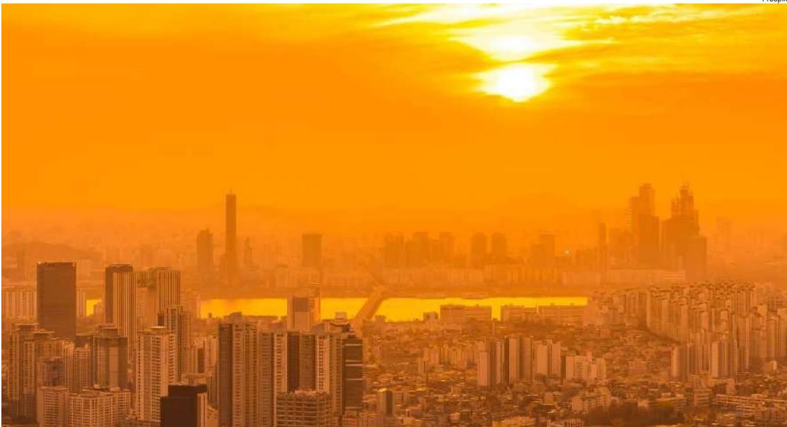
Falta de umidade causa graves riscos à saúde: desidratação, agravamento de problemas respiratórios e sonolência

O curso, com carga horária de 64 horas, será dividido em dois módulos: o primeiro, sobre Rede de Água, de 29 de setembro a 2 de outubro; e o segundo, sobre Rede de Esgoto, de 27 a 30 de outubro. As aulas ocorrerão de segunda a quinta-feira, das 8h às 17h, na Casa do Trabalhador.