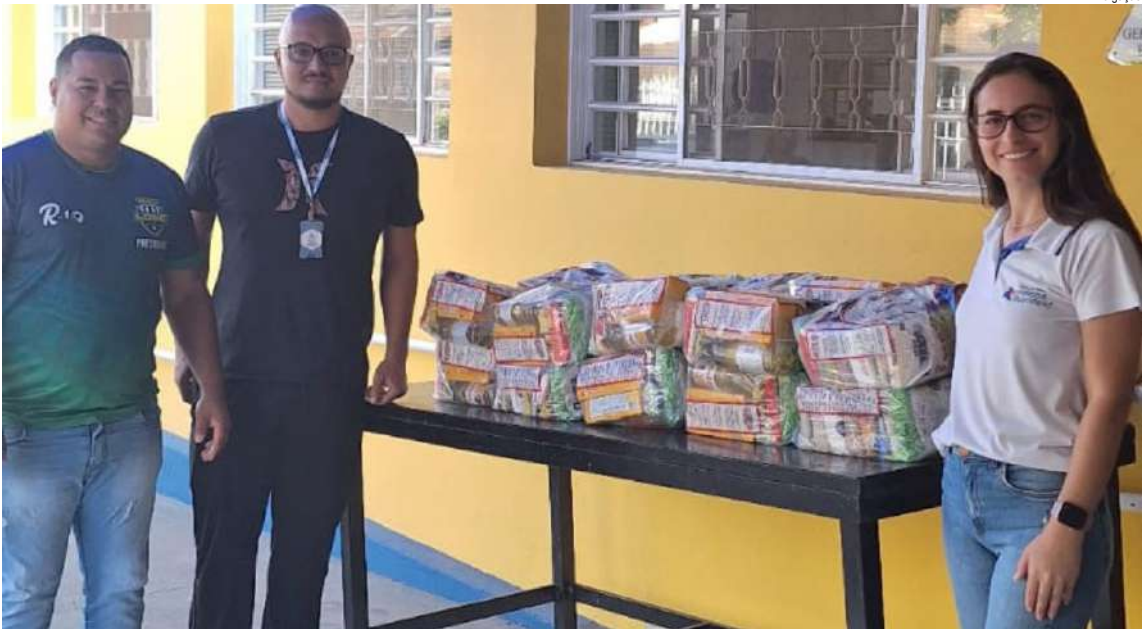
Momento da doação das cestas básicas: solidariedade e futebol caminhando juntos

Com essa nova ação, a Liga Desportiva de São Carlos reafirma que o esporte vai muito além das quatro linhas: também é solidariedade, cidadania e transformação.