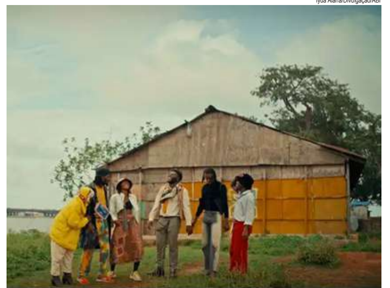
Cena do Filme 'O fardo da Nigéria', um dos destaques da Mostra de Cinemas Africanos