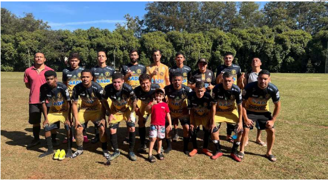
Santa Angelina ficou com a última vaga do G8

Já os rebaixados para a Série Prata serão Pé na Porta e Prohab, após uma campanha que não conseguiu acompanhar o ritmo das demais equipes.