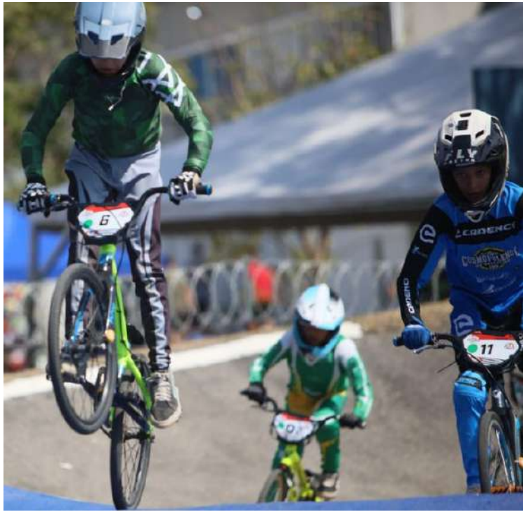
Pedala São Carlos promete brilhar na competição

Com determinação e talento, os ciclistas vão pedalar forte para trazer resultados expressivos e levantar o nome de São Carlos no BMX paulista!