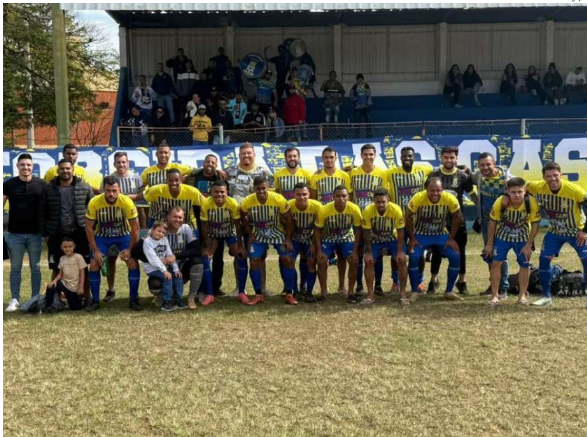
Primos tem uma tarefa árdua no Amador para chegar à final