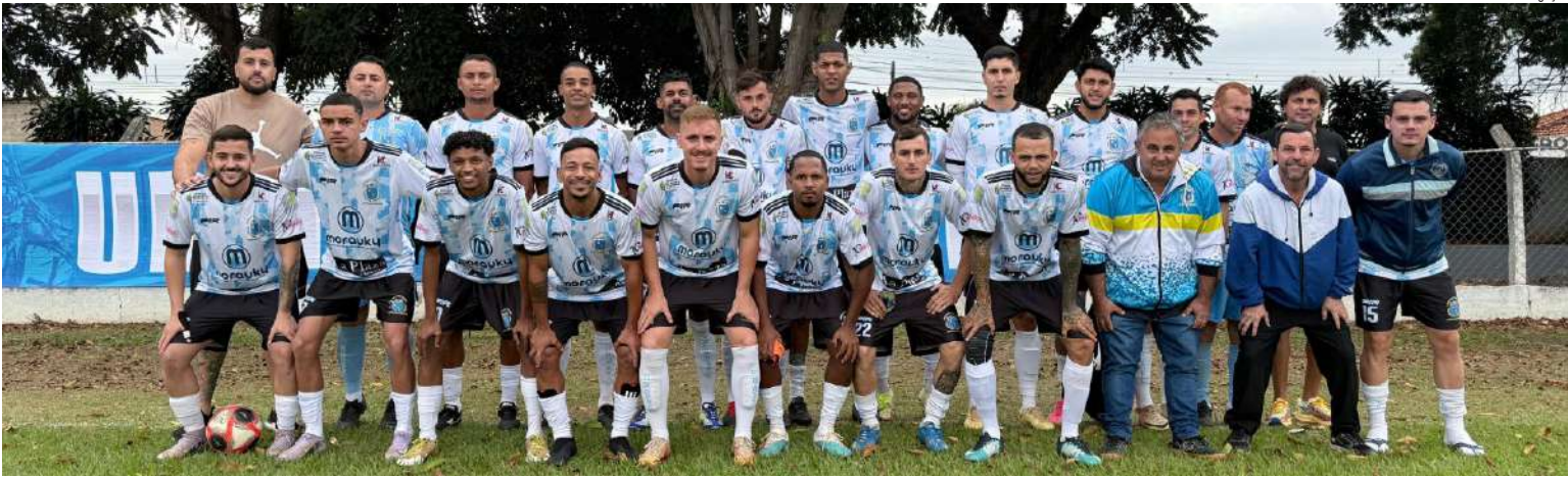
União Douradense joga em casa e busca a vitória

O domingo promete movimentação e expectativa em