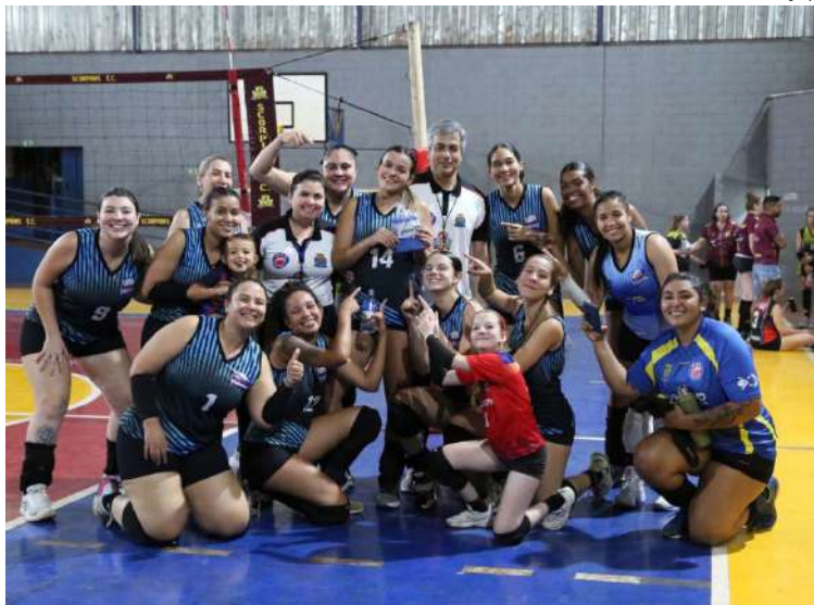
Jogadoras da AVS/Fusion comemora a segunda vitória na competição