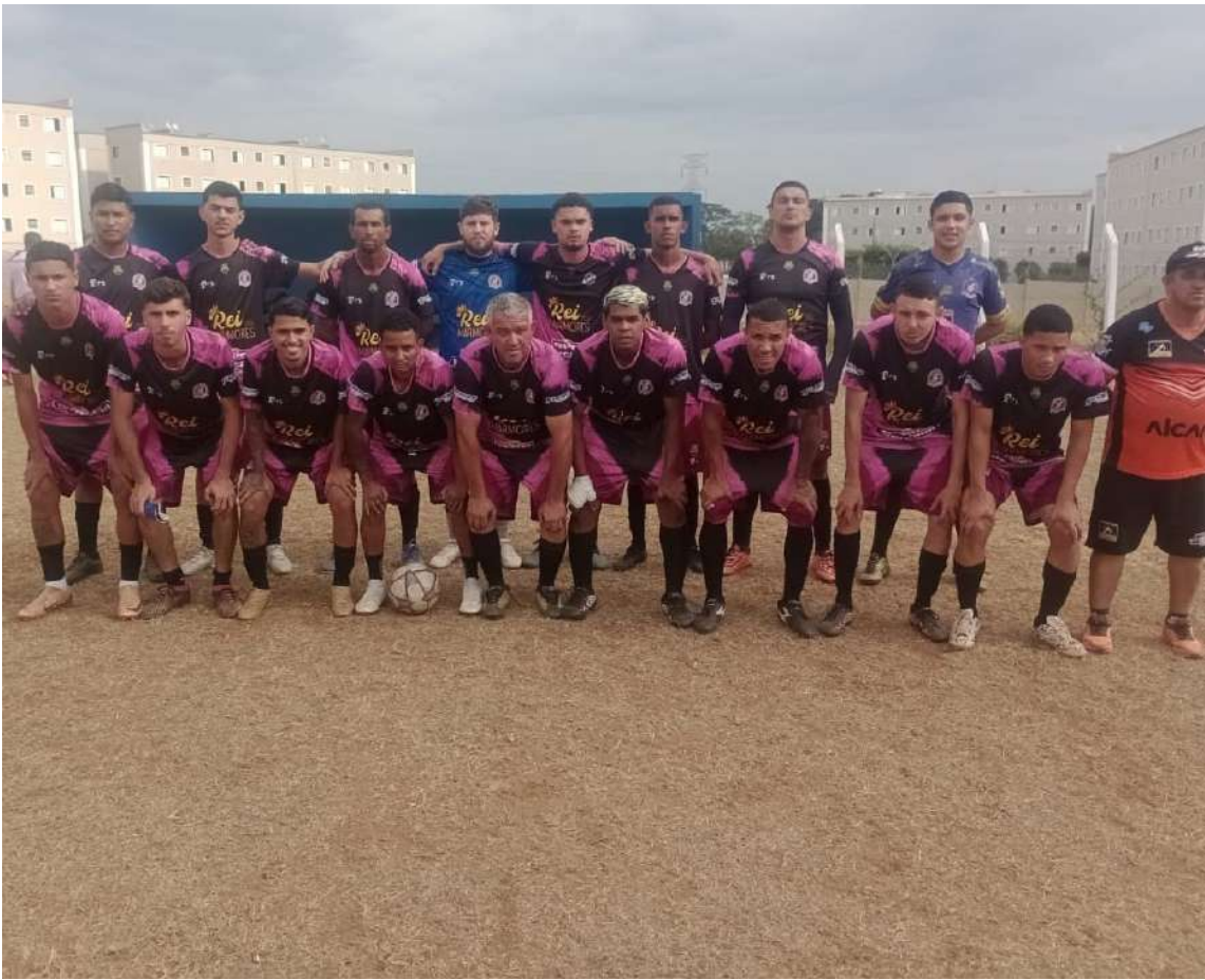
ABC joga para tentar a vice-liderança do Grupo A no Varzeano

Classificação Atual Grupo A Proara – 9 pts Santa Mônica – 7 pts ABC – 4 pts Tijuco Preto – 3 pts Paulistano – 0 pt São Carlos 8 – 0 pt Grupo B Centenário – 9 pts Jardim Beatriz – 5 pts Serse – 4 pts AGR 6 – 4 pts Al Quaeda – 3 pts Red Back – 0 pt