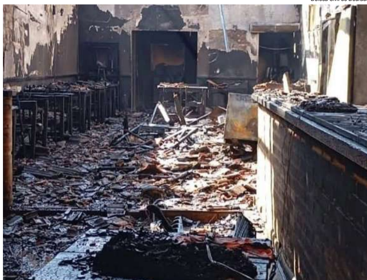
Defesa Civil de Dourado

Na manhã de sexta-feira, 12, um incêndio de grandes proporções destruiu uma pizzaria localizada na rua São Paulo, no Centro de Ribeirão Bonito.