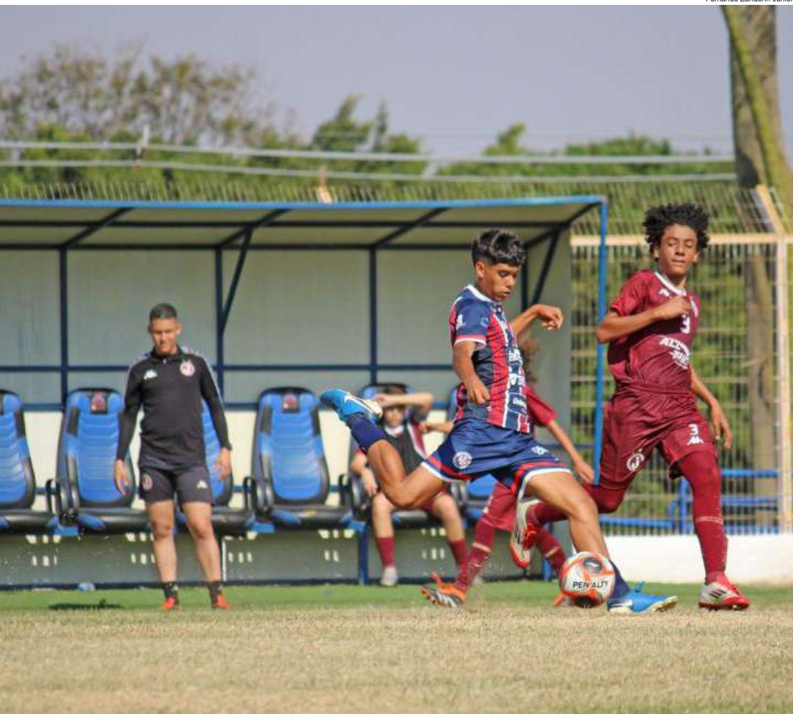
Na base da superação, Lobinhos buscam uma vitória histórica para seguir no Paulista