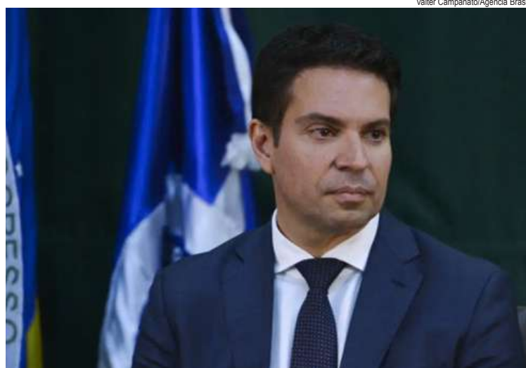
Valter Campanato/Agência Brasil

Medida deverá ser cumprida somente após o trânsito em julgado