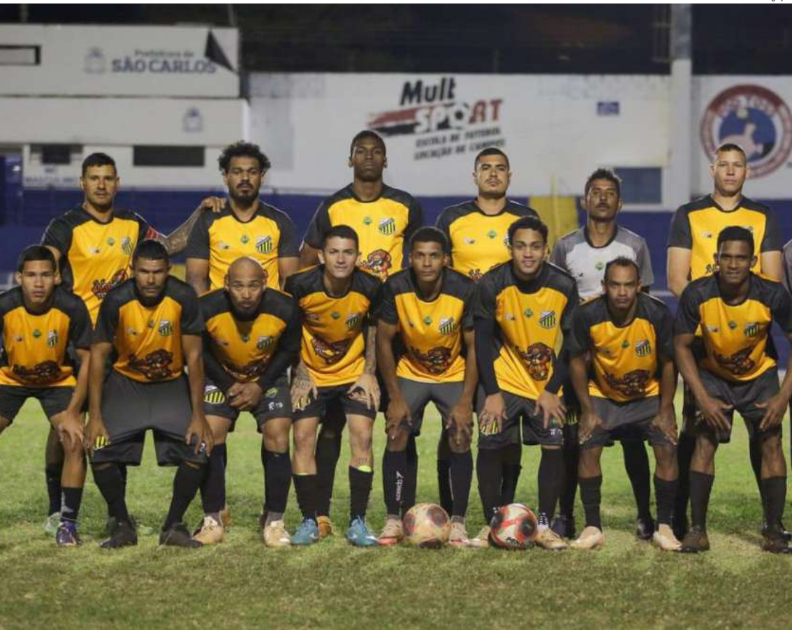
Grêmio encara o Marola em busca de vaga na final da Prata