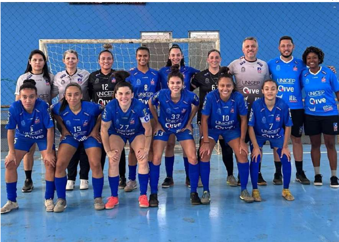
Pelo Paulista, ASF São Carlos venceu com autoridade Praia Grande

A partida promete fortes emoções para os torcedores e é considerada crucial para a sequência do Campeonato Paulista.