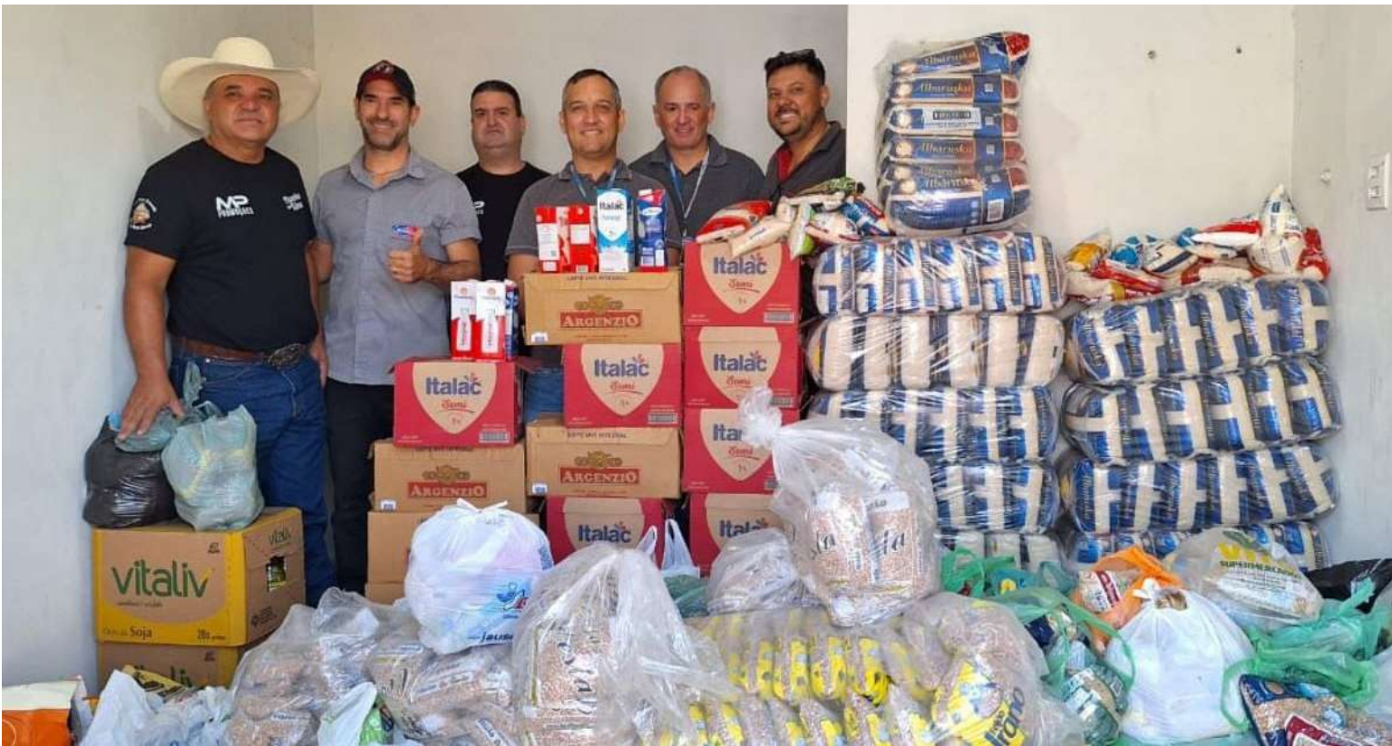
Momento em que era entregue os donativos arrecadados durante o São Carlos Rodeio Fest