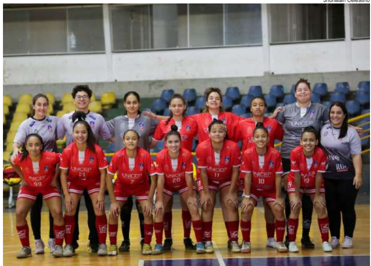
Equipe sub20 busca bom resultado para reagir no Paulista

A equipe sub-20 de futsal feminino da ASF São Carlos volta à quadra nesta terça-feira (16), às 16h, no ginásio municipal de esportes Milton Olaio Filho, para enfrentar o Taboão Magnus pelo Campeonato Paulista.