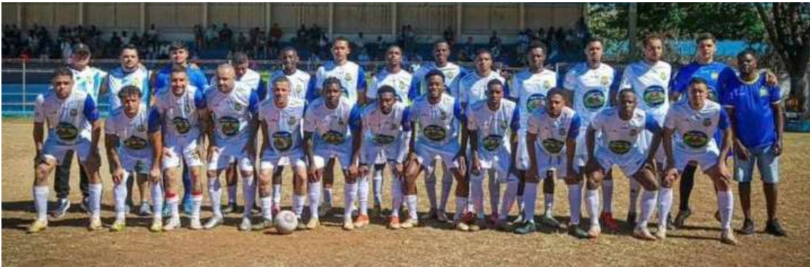
Os Prédios busca título inédito do Amador

O Estádio Municipal Luiz Estevan de Siqueira, o Zuzão, recebeu neste domingo (14) a segunda rodada da semifinal do Campeonato Amador, promovido pela Liga de Futebol Amador de São Carlos.