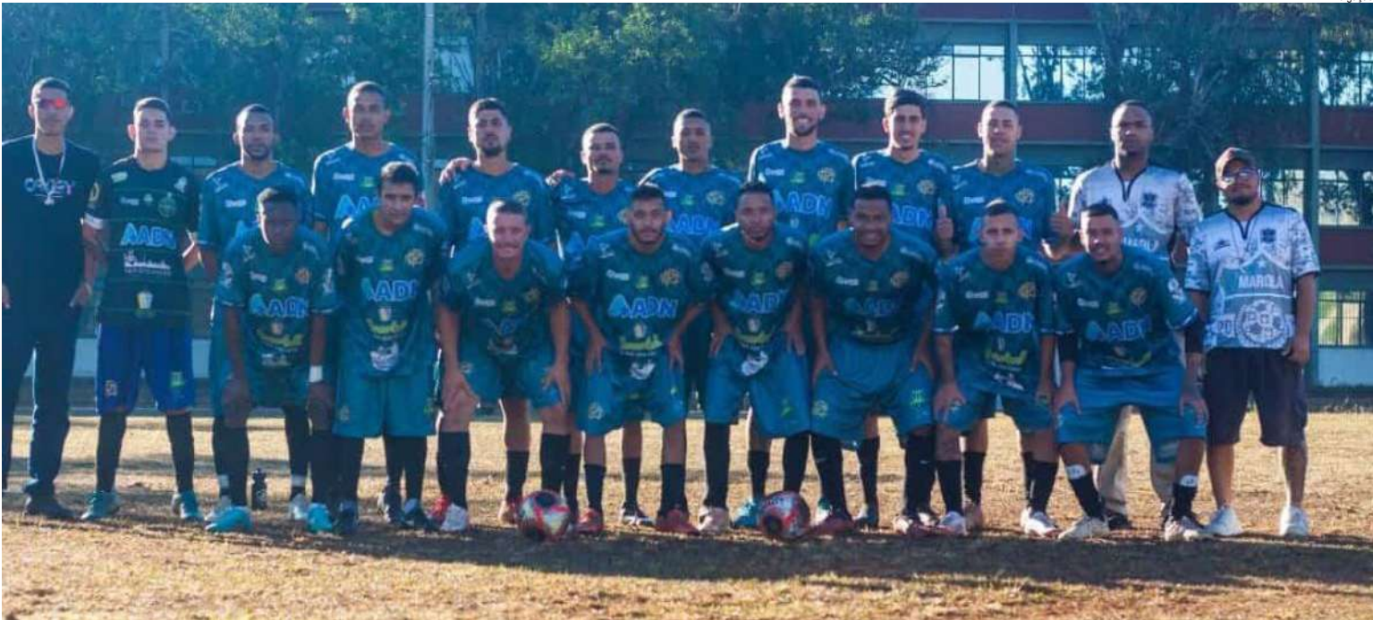
Marola Sanka superou o Grêmio por 2 a 0, construindo vantagem sólida para o jogo da volta

A Série Prata da Champions Cup, promovida pela Liga Desportiva de São Carlos, iniciou suas semifinais na tarde de domingo (14), no estádio municipal Professor Luís Augusto de Oliveira, o Luisão. No primeiro confronto, o Marola Sanka superou o Grêmio por 2 a 0, construindo vantagem sólida para o jogo da volta. Já na segunda partida, o Boca Juniors foi impiedoso e goleou o Várzea City por 4 a 1, abrindo ainda mais distância. Com os resultados, os vencedores jogam com ampla margem na partida decisiva: o Marola pode perder por até um gol de diferença e o Boca por até dois que, mesmo assim, estarão garantidos na grande final.