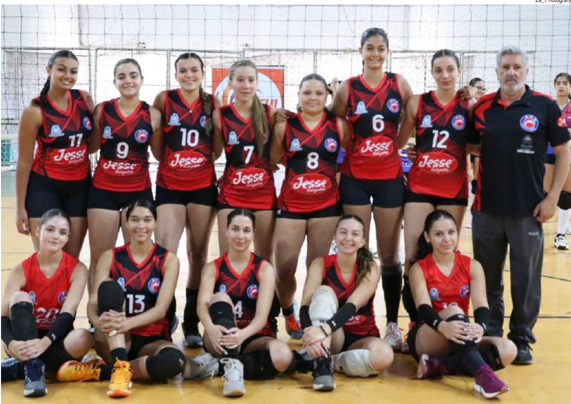
Após cinco jogos, a equipe infantil sofreu a primeira derrota na APV

“Mais do que o resultado, queremos que nossas atletas