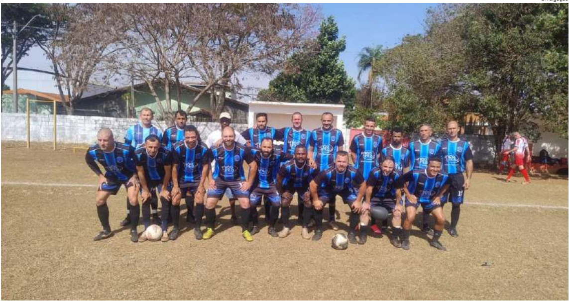
Cruzeiro faz uma boa campanha e lidera o Grupo Amarelo

2 Dínamo/Ponte Preta Ibaté – 7 pts 3 + ou – – 6 pts 4 Fortaleza/Sintufscar – 6 pts 5 Jardim Munique – 2 pts 6 Inter – 0 pt