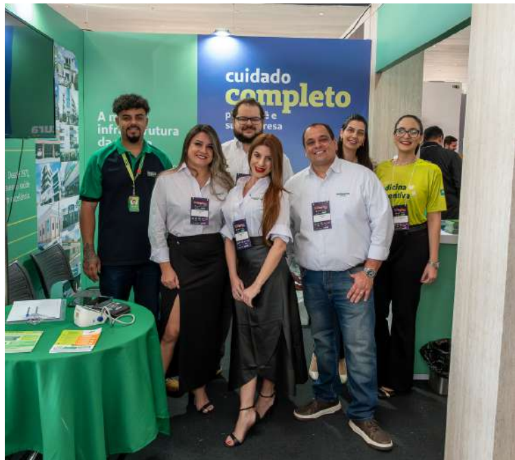
Equipe de Vendas, SOU e Viver Bem da Unimed São Carlos no primeiro dia do Business Summit

A primeira edição do Business Summit movimentou São Carlos nos dias 12 e 13 de setembro e reuniu empresas da cidade em torno de inovação, empreendedorismo e conexão de negócios. A Unimed São Carlos marcou presença e se destacou ao levar conhecimento e cuidado para os participantes.