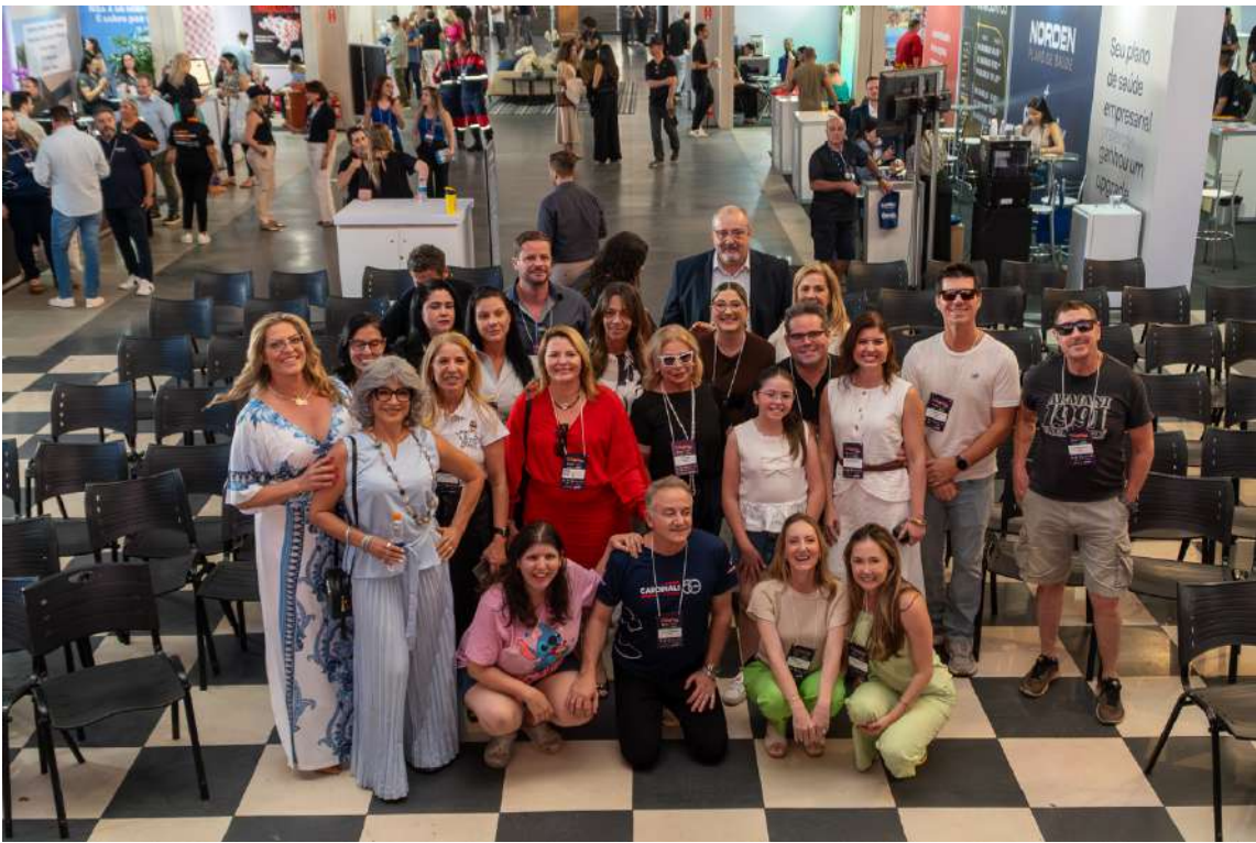
Geral do evento