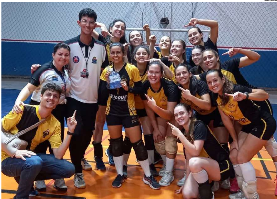
Em uma batalha de duas horas, o Caaso superou o Country

Neste último final de semana, a cidade mineira de Poços de Caldas recebeu a 6ª etapa do Campeonato Paulista de BMX Racing, a única etapa fora de São Paulo devido ao grande número de praticantes da modalidade. Entre eles, está o renomado piloto brasileiro Renato Resende, que participou de três Olimpíadas como atleta de ciclismo BMX.