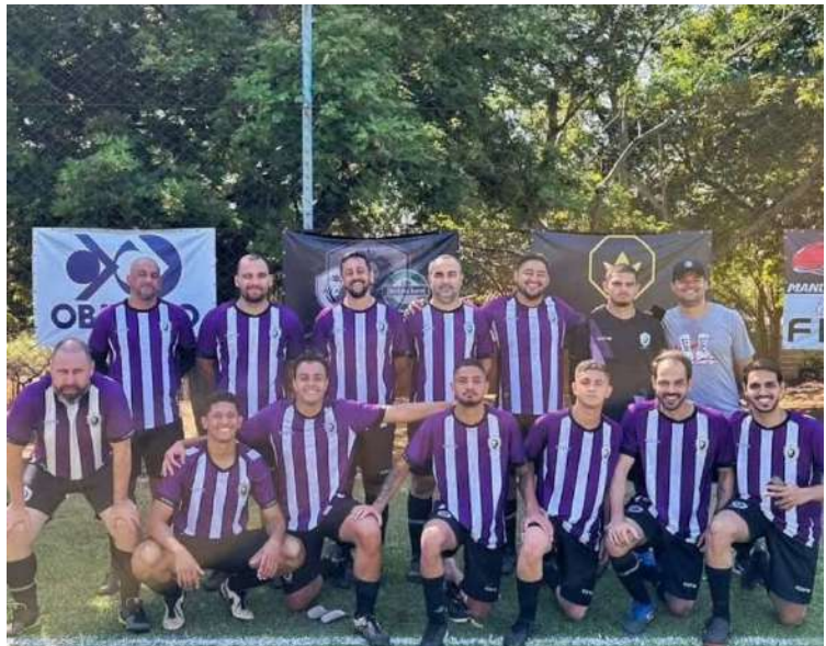
Polêmicos lidera o Interno de Futebol do Country: campanha sólida

O 46° Campeonato Interno do Country Club teve sequência na tarde de sábado (13) e domingo (14), com jogos emocionantes que movimentaram a tabela da competição.