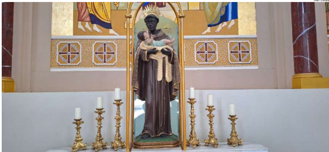
Festa em honra a São Benedito acontece oficialmente no dia 5 de outubro, data que em 2025 cai em um domingo

Festa em honra a São Benedito acontece oficialmente em 5 de outubro