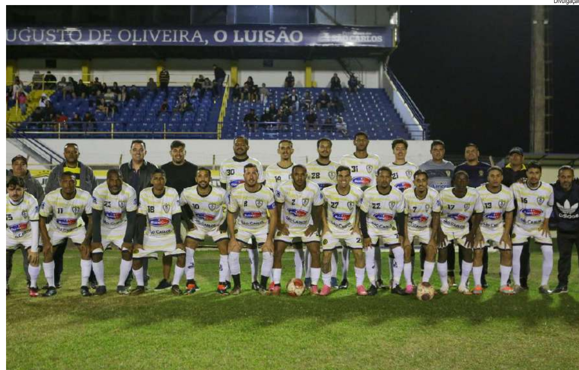
Após vencer o primeiro jogo, o Gonzaga joga pelo empate

O Campeonato Amador de São Carlos, promovido pela Liga de Futebol Amador, conhecerá neste domingo (28) o seu grande campeão. O palco da decisão será o Estádio Municipal Professor Luís Augusto de Oliveira, o Luisão, a partir das 9h, com o confronto entre Jardim Gonzaga e Os Prédios.