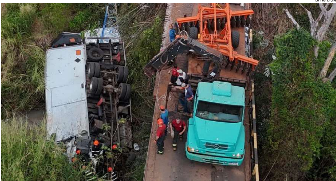
Le Petit Drones

Atendem à ocorrência o Corpo de Bombeiros de São Carlos e Araraquara, o helicóptero Águia da Polícia Militar, a Defesa Civil de Ribeirão Bonito e Dourado, a Polícia Técnico-Científica, além de médicos, enfermeiros municipais e o Policiamento Territorial.