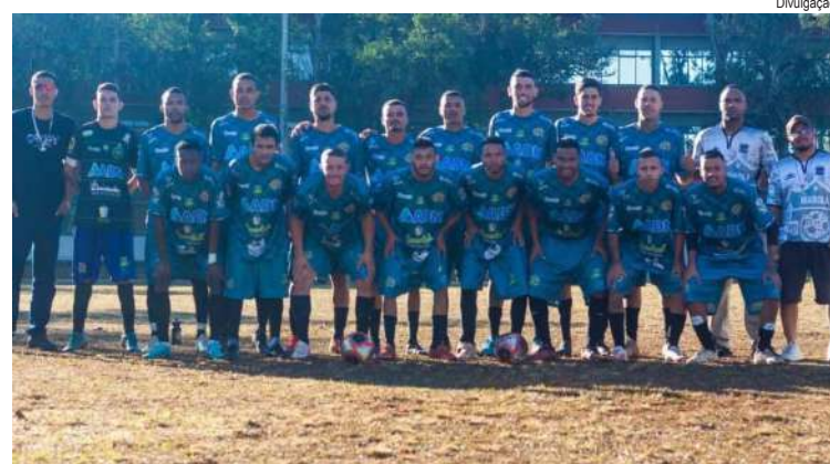
Marola Sanka busca título e pega o Boca

A bola vai rolar para a grande decisão da Série Prata da Champions Cup, promovida pela Liga Desportiva de São Carlos. Neste domingo (28), às 14h, no Estádio Municipal Dagnino Rossi, em Ibaté, acontece o primeiro jogo da final entre Boca Juniors e Marola Sanka.