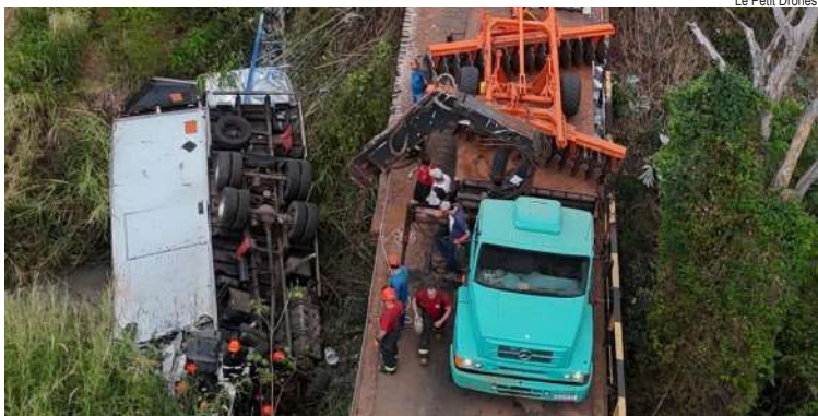
Le Petit Drones

Um acidente de trânsito envolvendo um veículo de carga foi registrado em uma estrada municipal que liga Ribeirão Bonito a Trabiju na manhã de sexta-feira. O caminhão despenca de uma ponte de cerca de 7 metros de altura. Uma pessoa precisou ser socorrida, presa entre as ferragens.