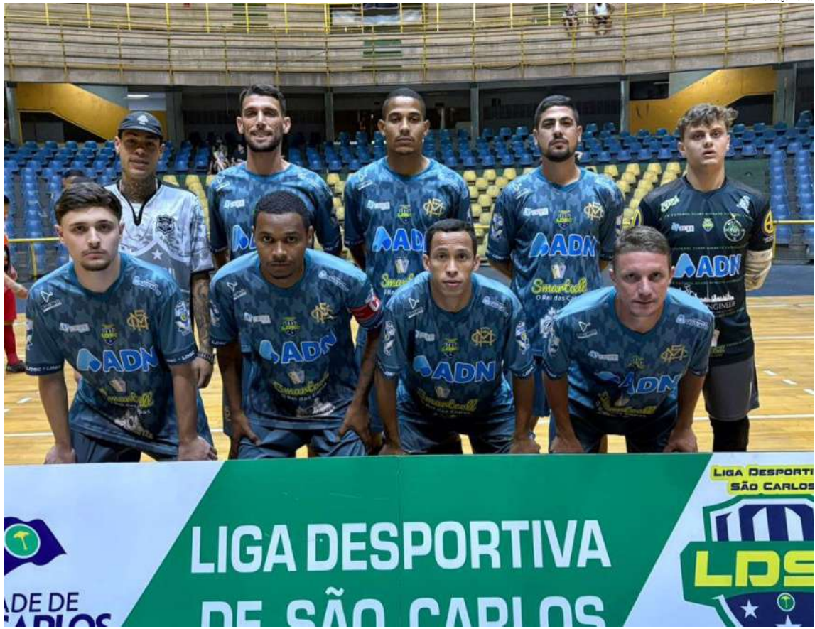
Marola está classificado para a segunda fase e é um dos candidatos ao título

A primeira fase da Taça São Carlos de Futsal 2025 terminou na última sexta-feira (3) repleta de gols, emoção e partidas eletrizantes. Os ginásios Milton Olaio Filho e Hugo Dornfeld foram palco de confrontos acirrados, com equipes lutando ponto a ponto por uma vaga na próxima fase.