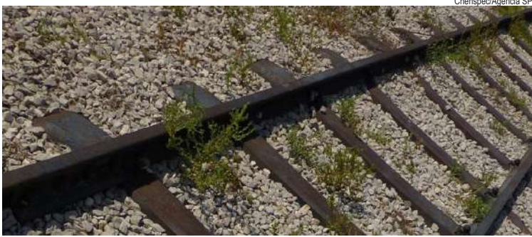
Três tipos de dormentes são comumente utilizados: o de madeira, o de concreto e o de aço

sua durabilidade, por exemplo. De acordo com Purquerio, essa ocorrência é mais comum em dormente brutos e maciços. A escolha do formato tem inspiração na natureza, como o abrigo construído pelas abelhas. “Quando se deseja alta resistência e baixo peso, nós usamos essa estrutura”, explica. As dimensões externas do dormente seguem as exigências da Associação Brasileira de Normas Técnicas (ABNT), mas seu interior é composto de pequenas formas hexagonais. A inovação é mais leve quando comparada às demais disponíveis no mercado. “Particularmente os dois terços de cada extremidade são preenchidos com um granito sintético, para atingir o peso mínimo e trazer resistência e amortecimento das vibrações”, demonstra. Devido à aposentadoria de Benedito Purquerio, a inovação segue em andamento nas mãos do professor Carlos Fortulan, também do Departamento de Engenharia Mecânica da EESC. Ele complementa: “O próprio vazado auxilia na refrigeração e possibilita que se usem equipamentos de menor dimensão. É pouco suscetível ao trincamento e às intempéries do tempo”. SUSTENTABILIDADE Por ser produzido a partir de