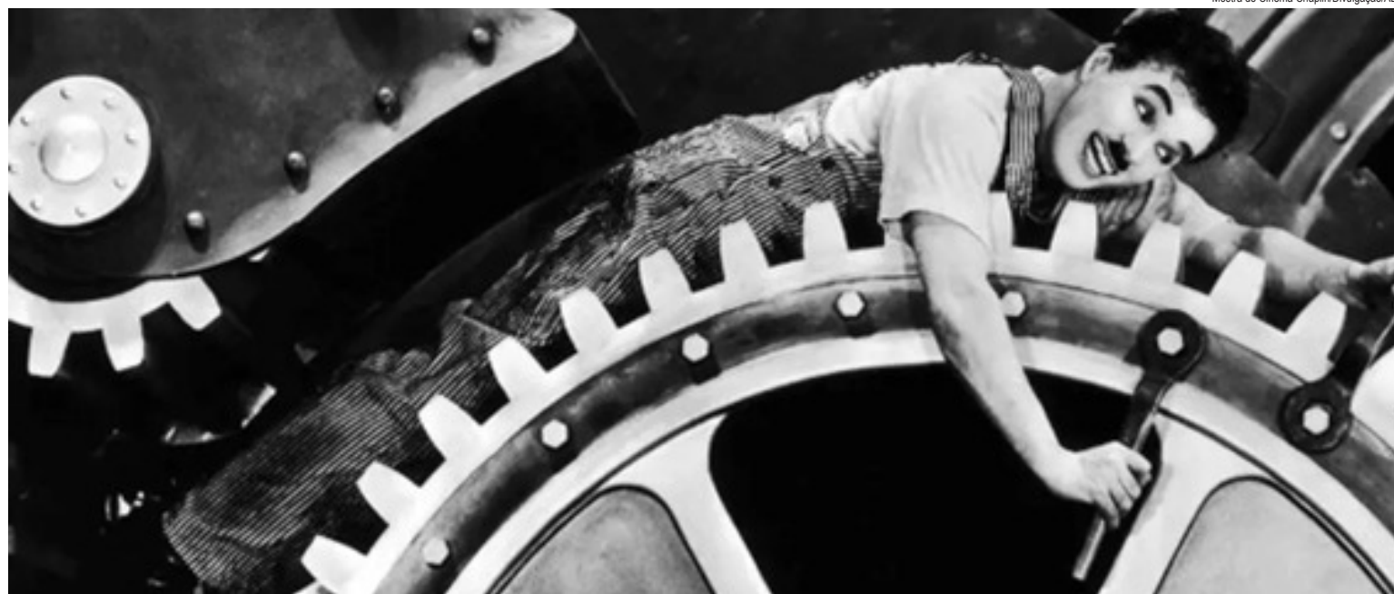
Mostra de Cinema Chaplin/Divulgação/ABR

Também serão exibidos curtas dos estúdios Keystone, Essanay e Mutual, incluindo Corrida de automóveis para meninos (1914).