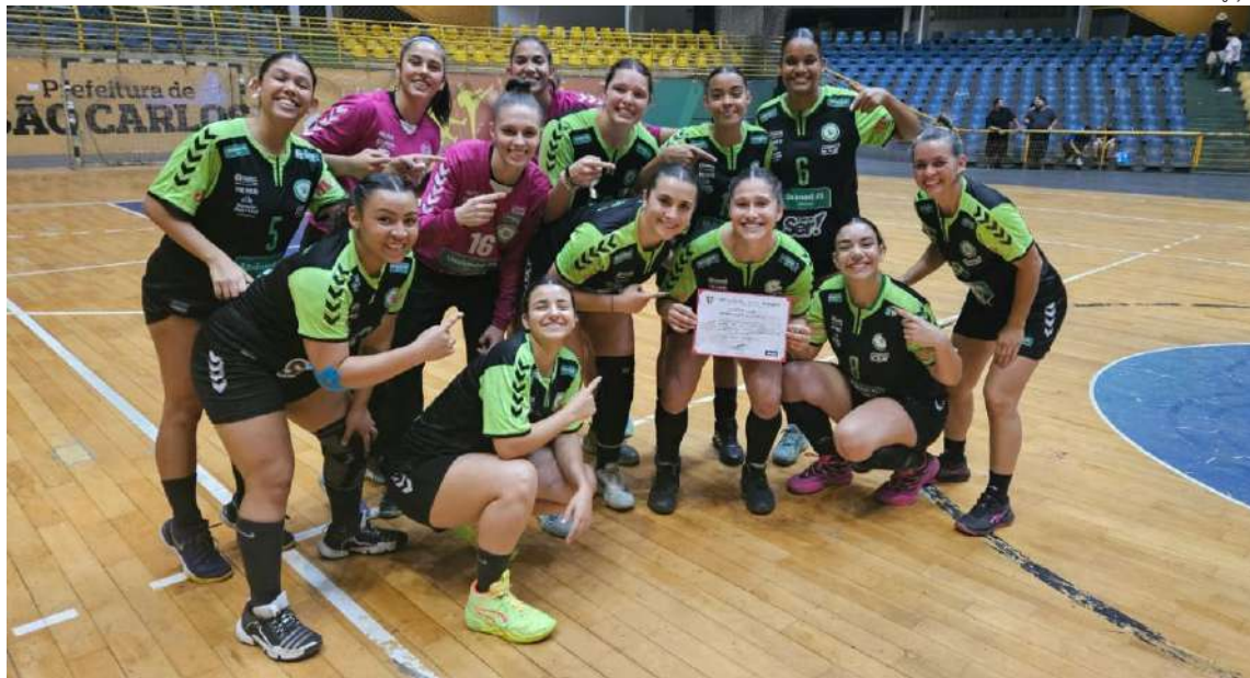
Sorocaba superou o H7/La Salle em um bom jogo

Mas time segue vivo no Campeonato Paulista