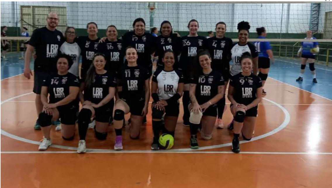
Fênix conquistou importante vitória e sonha com o G4