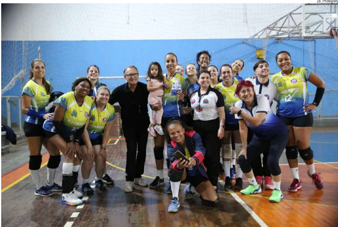
Jogadoras da AVS comemoram vitória e liderança