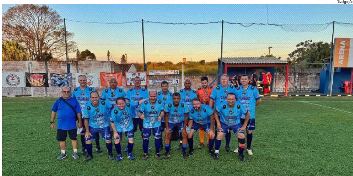
Os Parças encostou e briga pela ponta no Master

A igualdade entre São Francisco e Som da Festa mantém o equilíbrio na ponta da tabela: Auto Mecânica São Francisco lidera com 19 pontos, seguida de Som da Festa/Delícias da Lala com 18, e Os Parças F.C./Erick Seguros/Grupo Marciano com 17. Apenas dois pontos separam as três equipes, tornando cada partida decisiva e cada gol motivo de celebração saudável. Outros resultados da rodada: JMV 1 x 0 Kalhandra Uniformes/Agnes Assessoria Esportiva Casculo 2 x 2 Eng-p Engenharia/Torresmo do Cesão Vila São José 2 x 5 Os Heineken/Polemicos F.C. Zanchin Bebidas/Bike Solution 1 x 0 Os Fabricios A competição segue promovendo não apenas o espírito competitivo, mas também a integração entre jogadores