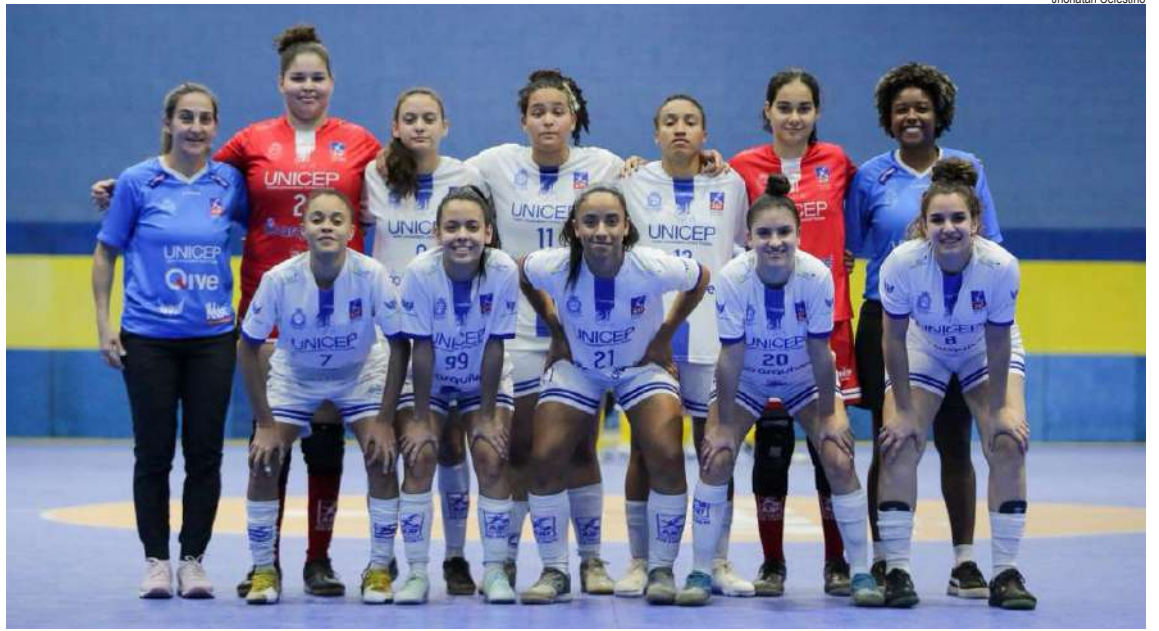
Equipe sub20 faz o primeiro jogo em casa e tem que vencer para se colocar em vantagem

A equipe são-carlense sabe que cada jogada, cada interceptação e cada finalização podem fazer a diferença neste momento decisivo do campeonato. E com o apoio da torcida no Milton Olaio