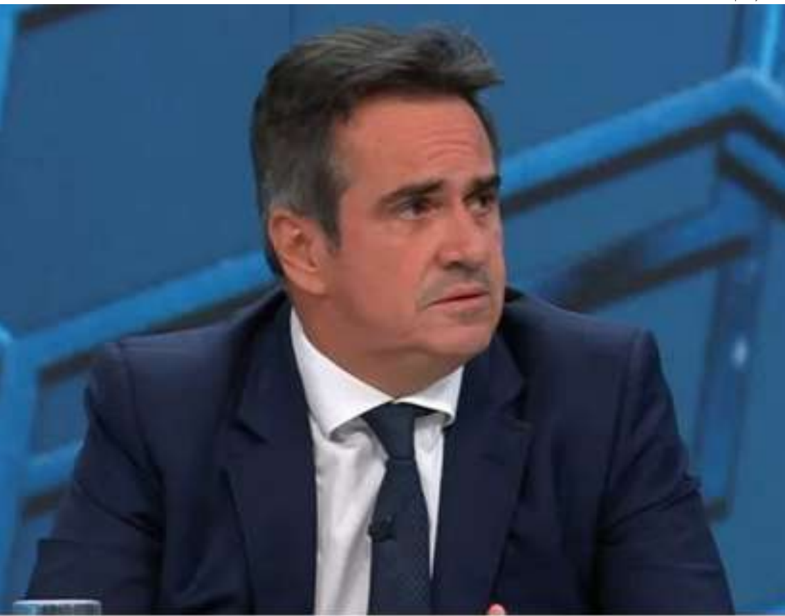
Ciro Nogueira não quis dizer se Jair Bolsonaro já deu sinais de quem poderia apoiar

O impasse em torno do tema, conforme o senador, não pode ficar eternamente sem solução. “Parece que é para que isso consiga ser votado, para sempre ficar com essa discussão, sempre ficar com essa defesa ou ataque a essas posições. Eu acho que isso está fazendo muito mal ao nosso País, essa discussão interminável, porque acaba se colocando em segundo plano o que realmente interessa para a população.”