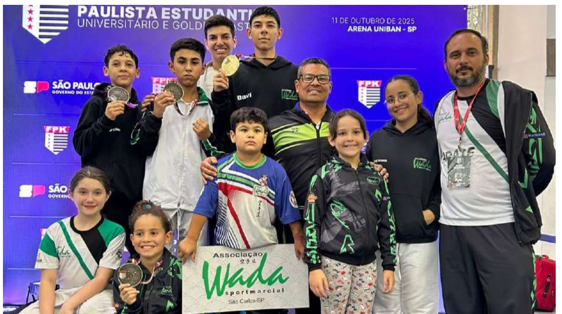
Equipe são-carlense brilhou na competição e aumentou galeria de conquistas