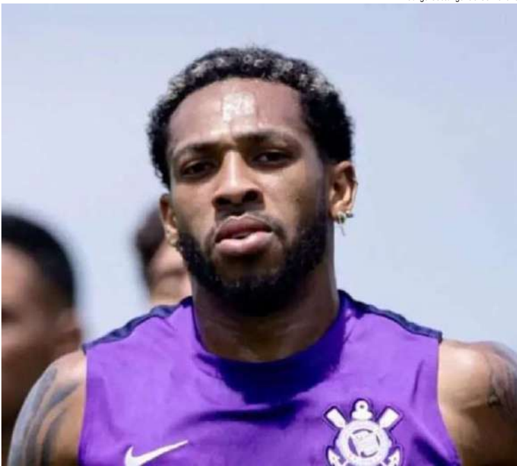
Rodrigo Coca/Agência Corinthians