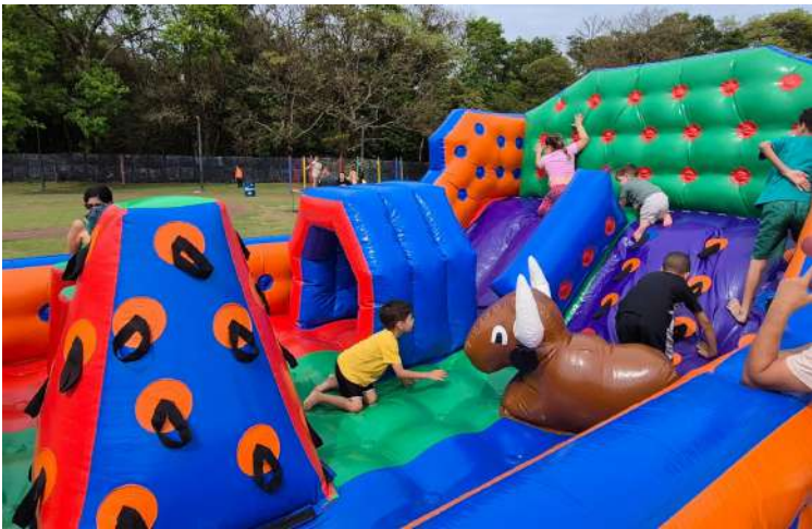
promovidas pela Prefeitura Municipal de Ibaté. O evento contou com uma ampla programação

Milhares de ibateenses passaram pela Pirâmide da Mata do Alemão no domingo, 12 de outubro, para celebrar o Dia das Crianças em uma manhã repleta de diversão, alegria e atividades gratuitas