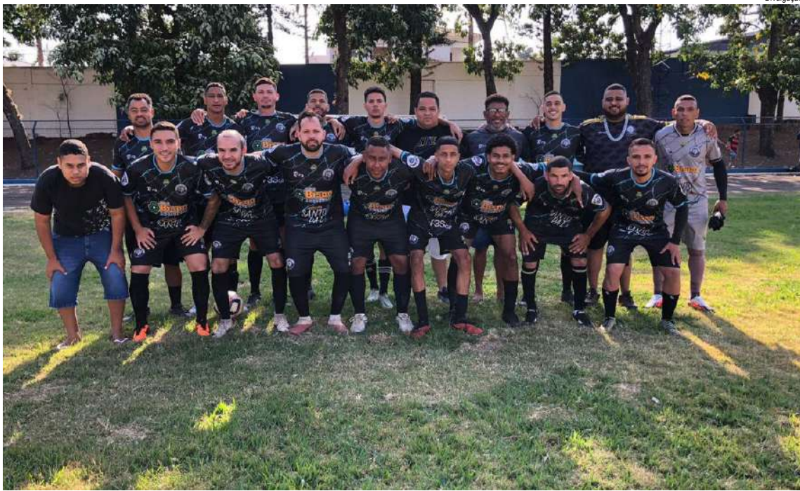
Mulekes de Villa goleou e fará a final da Champions Cup

O domingo foi de pura emoção no Estádio Municipal Parque São Pedro, em Dourado, palco das semifinais de volta da Champions Cup Série Ouro, competição promovida pela Liga Desportiva de São Carlos. Sob um sol generoso e arquibancadas pulsando com o apoio das torcidas, Mulekes de Villa e Tijuco Preto garantiram, com muita garra e superação, as vagas na grande decisão da temporada 2024.