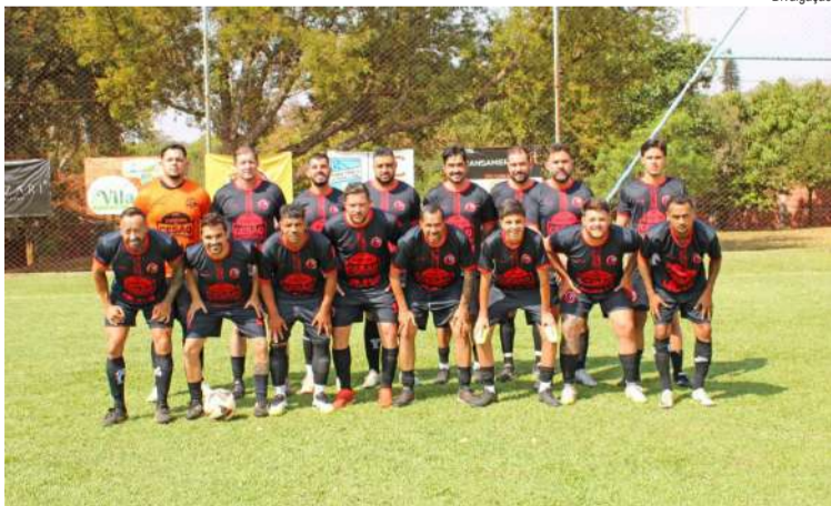
Torresmo do Cesão assumiu a terceira colocação do Interno

Classificação: 1 - Saf Zabosados/Aplitec | 21 pts 2 - Polêmicos/Os Heinekens | 21 pts 3 - Torresmo do Cesão/JMV | 20 pts 4 - Hotel Transamérica Fit