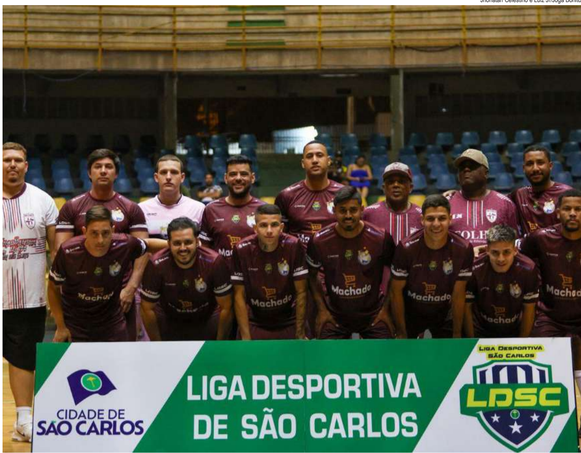
Zé Bebeu está com 100% de aproveitamento na 2ª fase

Na segunda-feira, 13, as partidas mostraram a força de algumas equipes que vêm se destacando desde a primeira fase. Zé Bebeu, com uma vitória categórica por 5 a 1 sobre o Prohab, manteve o aproveitamento perfeito, assumindo a liderança do seu grupo com 6 pontos. Na mesma linha de performance impecável, Marola superou o Caaso por 4 a 3, também atingindo 100% de aproveitamento e mostrando que não veio para brincadeira nesta Taça.