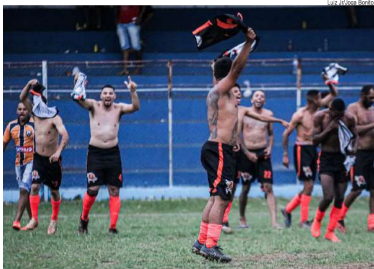
É só felicidade: jogadores do AGR 6 comemoram passagem a final do Varzeano