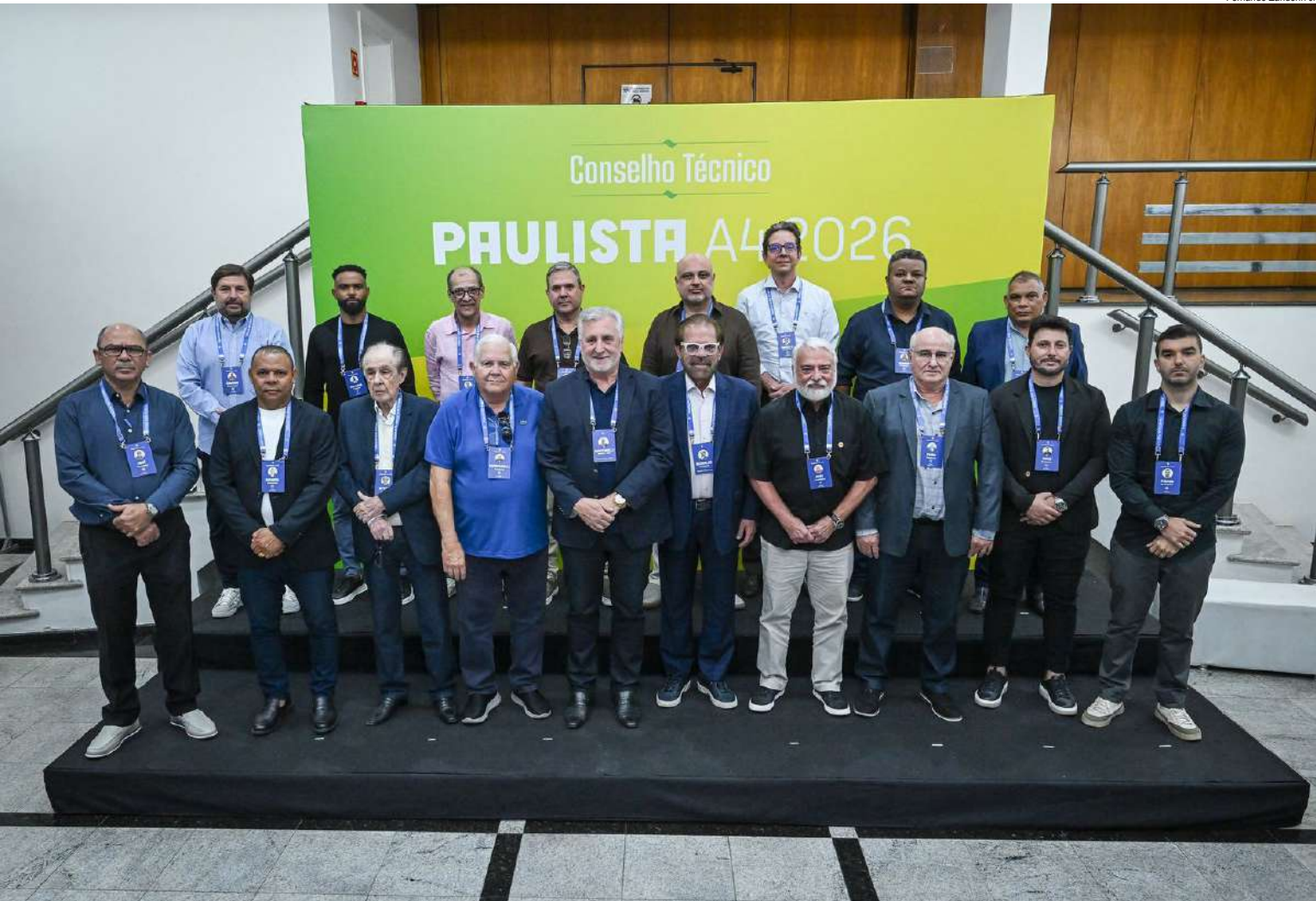
Representantes das equipes 16 participantes que irão disputar a A4 em 2026

Participam da competição as seguintes equipes: Lemense, Comercial (rebaixados da Série A3 em 2025), Araçatuba, Nacional, Taquaritinga, Joseense, São Caetano, Colorado Caieiras, Inter de Bebedouro, Vocem, Jabaquara, Penapolense, Barretos,