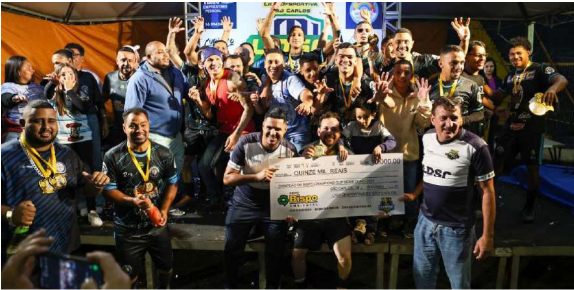
Mulekes de Villa comemora o título inédito da Champions Ouro

Emoção, alegria e títulos inéditos marcaram a grande festa de encerramento da Champions Cup 2025, nas Séries Prata e Ouro, promovidas pela Liga Desportiva de São Carlos. Nem mesmo a chuva que caiu sobre a cidade antes do início das partidas foi capaz de atrapalhar o espetáculo, que entrou para a história do futebol amador de São Carlos.