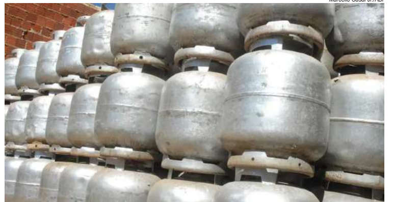
Marcello Casal Jr./ABr

Famílias residentes em 39 municípios de seis estados brasileiros que tiveram situação de