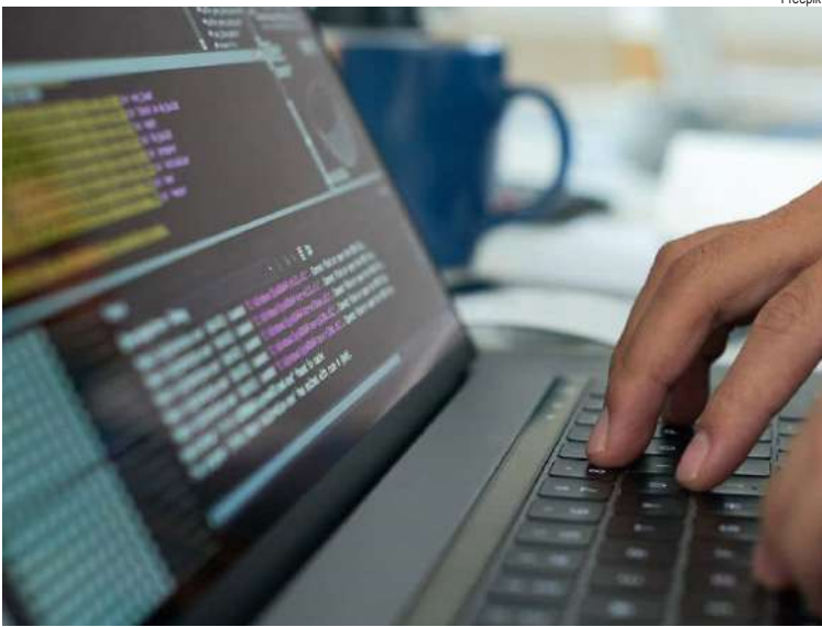
Curso busca preparar os inscritos para projetos em desenvolvimento web

Voltada a qualquer pessoa interessada, sem necessidade de experiência prévia em programação, formação será oferecida pela ICMC Júnior e pela InfoBio Jr