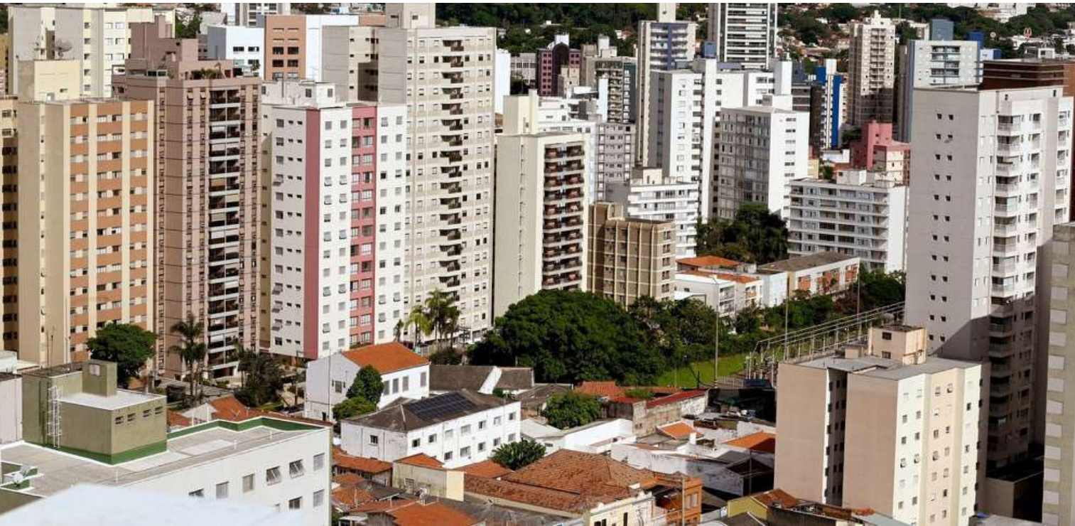
Depósitos efetuados a partir de 1º de janeiro de 2026 na conta Participação dos Municípios na Arrecadação do ICMS serão repassados aos municípios por intermédio do Banco do Brasil

No portal da Sefaz-SP, na aba de Transparência, é possível realizar a consulta do IPM por município e comparar os índices de acordo com os anos-base. Há também a possibilidade de realizar o download do