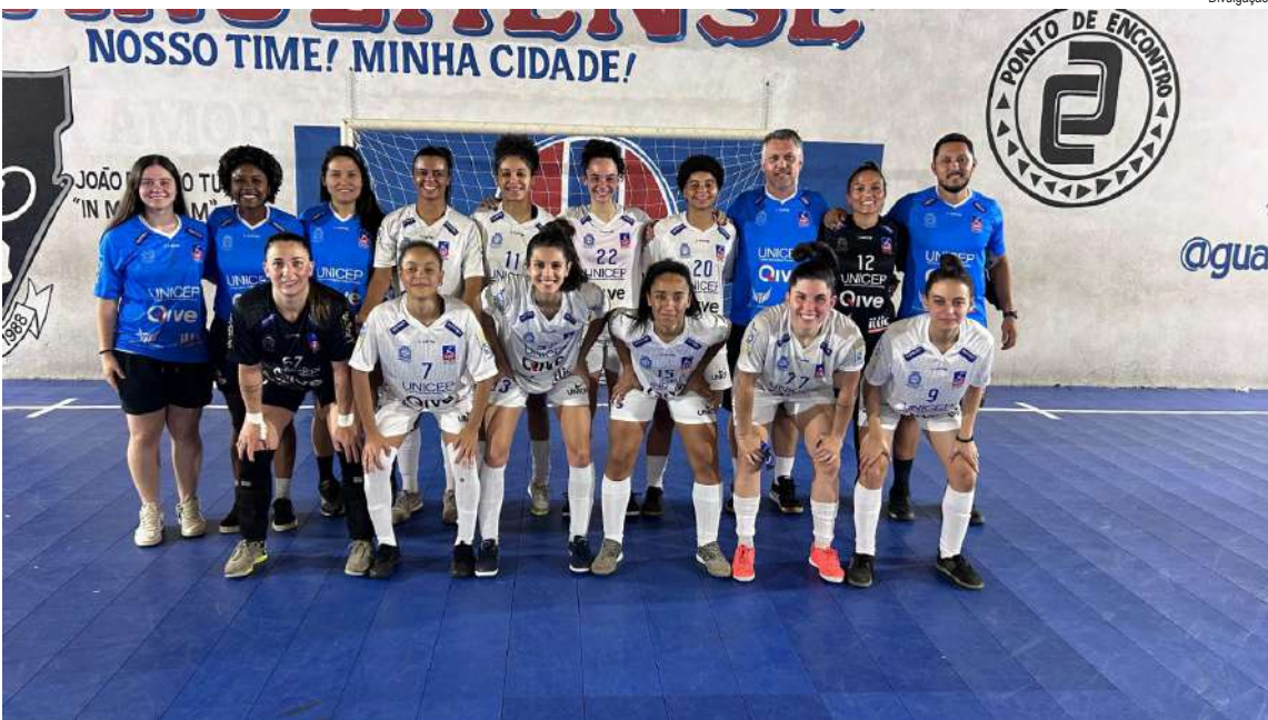
Equipe feminina da ASF Unicep brilhou com duas vitórias no final de semana

seguidas e desempenho consistente, a ASF reafirma seu