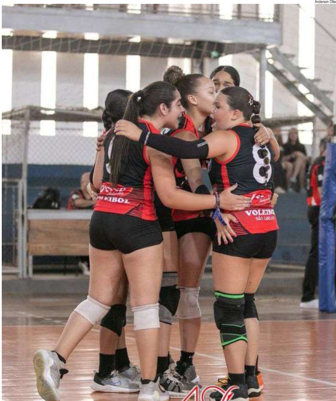
AVS venceu e se garantiu nas finais da Taça de Ouro

Arbitragem: Fausto José de Lara e Osni Luciano Martins. Apontador: Wladimir do Carmo.