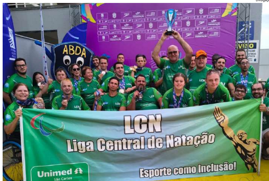
Equipe são-carlense comemora a conquista dos expressivos resultados

O resultado reafirma a força e a tradição da cidade na paranatção paulista, mostrando que o trabalho árduo, a disciplina e a paixão pelo esporte são capazes de transformar esforço em conquistas memoráveis. São Carlos celebra não só as medalhas, mas também a determinação e o espírito de suas paratletas, que inspiram toda a comunidade esportiva.