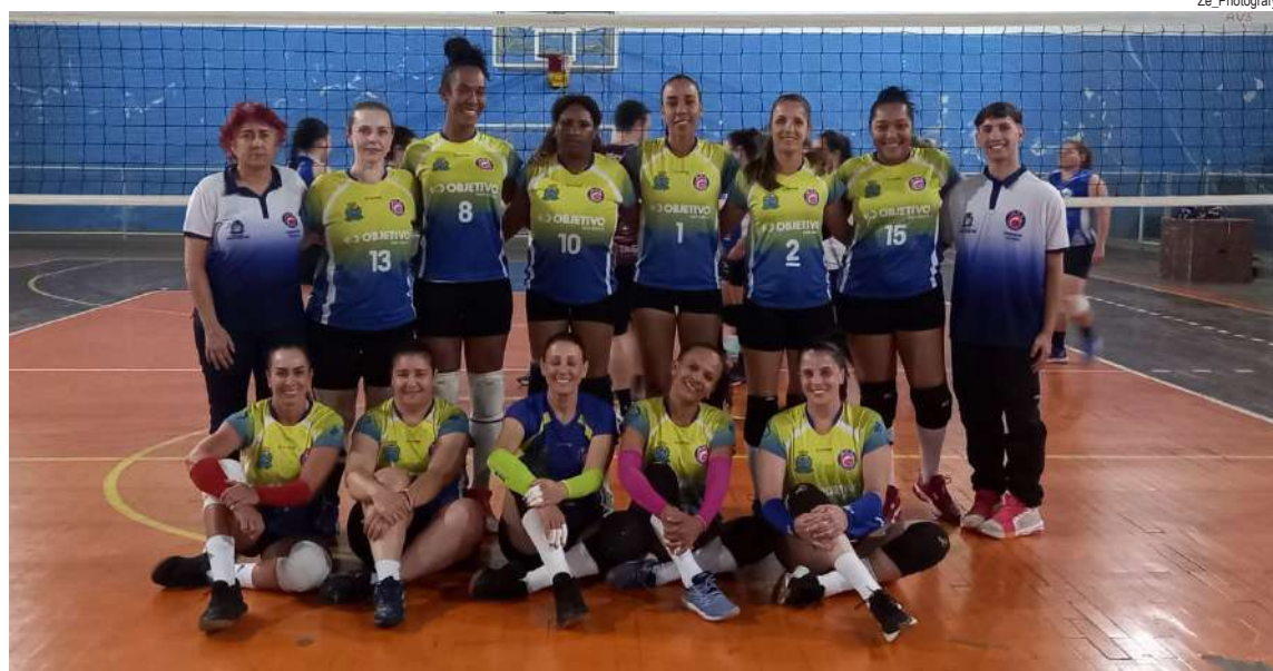
Atual campeã, AVS busca a vitória para ser mais uma vez finalista

O Ginásio Municipal de Esportes José Eduardo Gregoracci, no Jardim Santa Felícia, será palco de mais um capítulo da Copa AVS/Smec de Vôlei Feminino. Nesta terça-feira (28), às 20h30, a atual campeã e invicta AVS entra em quadra contra o Country Club pela semifinal 2 da Série Ouro, em um confronto que promete fortes emoções.