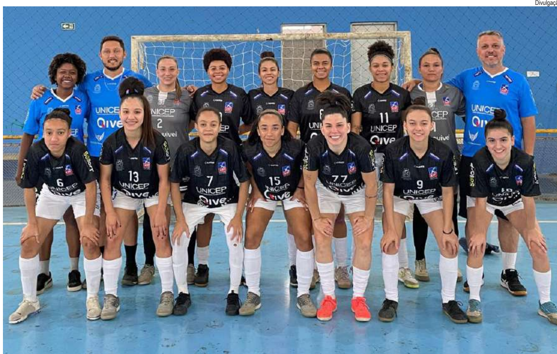
Asf Unicep voltou a vencer o Guarulhense e está na semi do Paulista

“Sabemos que a equipe de São José é favorita, por sua experiência e estrutura como