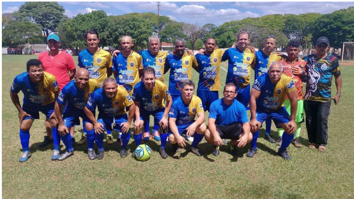
Esportiva ficou no 1 a 1 com o São João Batista/