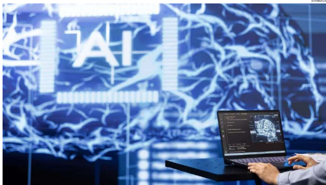
Para participar do curso, é preciso ter conhecimento prévio em linguagens de programação, além de familiaridade com o sistema operacional Linux