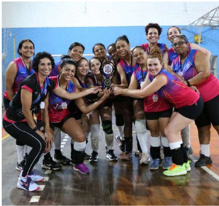
Jogadoras do Alpha comemoram a conquista da Série Bronze

Em final eletrizante, equipe leva Série Bronze da Copa AVS/Smec