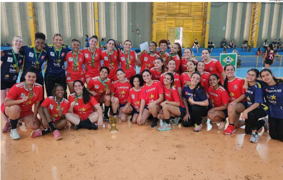
Equipe são-carlense busca uma colocação histórica no Paulista

Para São Carlos, conquistar o bronze representa mais do que um troféu: é o reconhecimento da força e dedicação da equipe ao longo da temporada, encerrando o campeonato com uma vitória histórica e mostrando que a cidade mantém seu destaque no handebol feminino paulista.