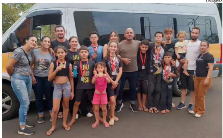
A equipe conquistou 12 medalhas em um evento marcado pelo alto nível técnico

reforçam a força e o espírito esportivo da ASA, mostrando que, mesmo em provas desafiadoras e sob condições adversas, os atletas de São Carlos continuam conquistando resultados expressivos e inspirando a comunidade.