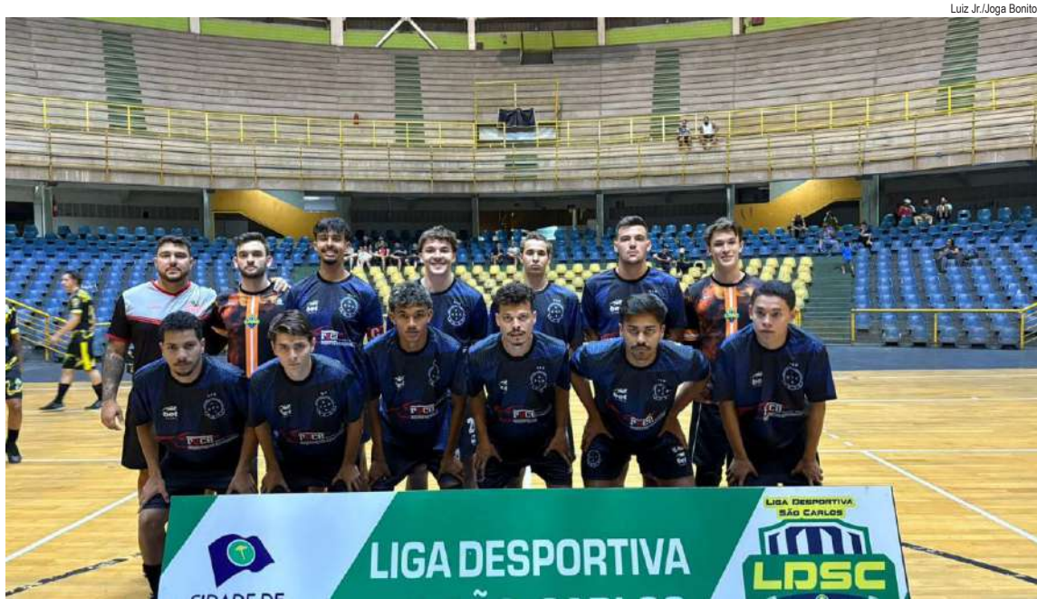
Cruzeiro do Sul venceu e garantiu classificação para a terceira fase

A quarta rodada da segunda fase da Taça São Carlos de Futsal, promovida pela Liga Desportiva de São Carlos, trouxe resultados que deixaram o Grupo B ainda mais disputado. Com exceção do