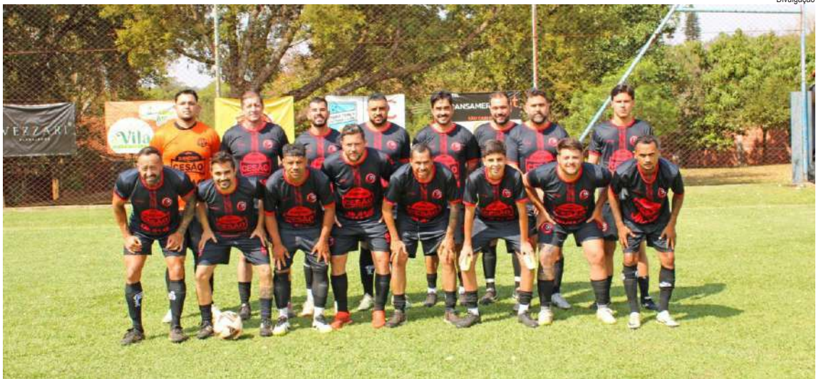
Torresmo do Cesão é o novo líder do Interno