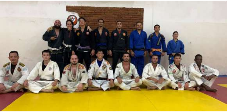
Equipe são-carlense fez bonito e conquistou expressivos resultados

A cidade de São Bernardo do Campo foi o centro das atenções do judô paulista nos dias 25 e 26 de outubro, ao sediar as finais