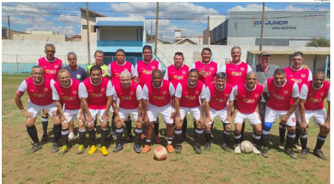
Arsenal é um dos líderes do Grupo Amarelo

O campeonato continua acirrando a disputa pelo título, com os times se preparando para os confrontos remarcados.