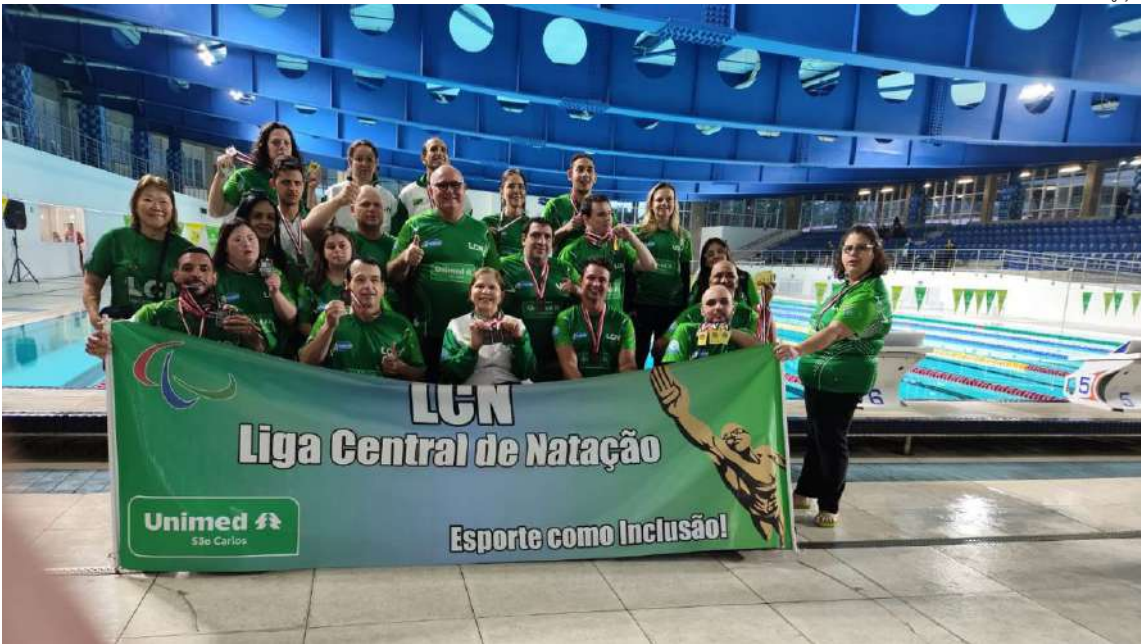
Equipe são-carlense brilhou e conquistou expressivo resultado no Paresp

Equipe conquista 30 medalhas, colocando a cidade entre as melhores do Estado