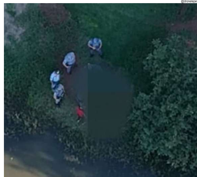
Corpo da vítima de 63 anos foi resgatado pelos Bombeiros

O Corpo de Bombeiros foi acionado imediatamente e iniciou as buscas no ponto indicado pela esposa da vítima. O corpo foi localizado cerca de uma hora e meia depois, a