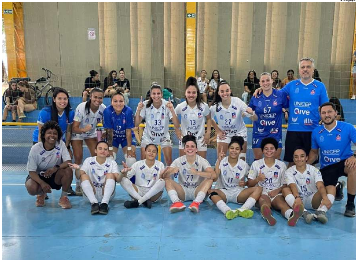
ASF/Unicep busca a vitória para tentar a final do Paulista

Equipe vai decidir vaga na final do Paulista