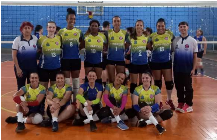
AVS está invicta e busca mais um título na Copa AVS/Smec

O ginásio vai tremer! Nesta terça-feira, 11, às 20h30, o Ginásio Municipal de Esportes José Eduardo Gregoracci, no Jardim Santa Felícia, será o palco da grande final da Série Ouro da Copa AVS/Smec de Vôlei Feminino. O duelo entre AVS e UFSCar promete ser eletrizante e inesquecível. O AVS chega invicto, determinado a manter o título conquistado em 2024, mostrando que cada treino, cada saque e cada defesa foram preparados para este momento. Do outro lado, a UFSCar entra com garra e fome de vitória, pronta para