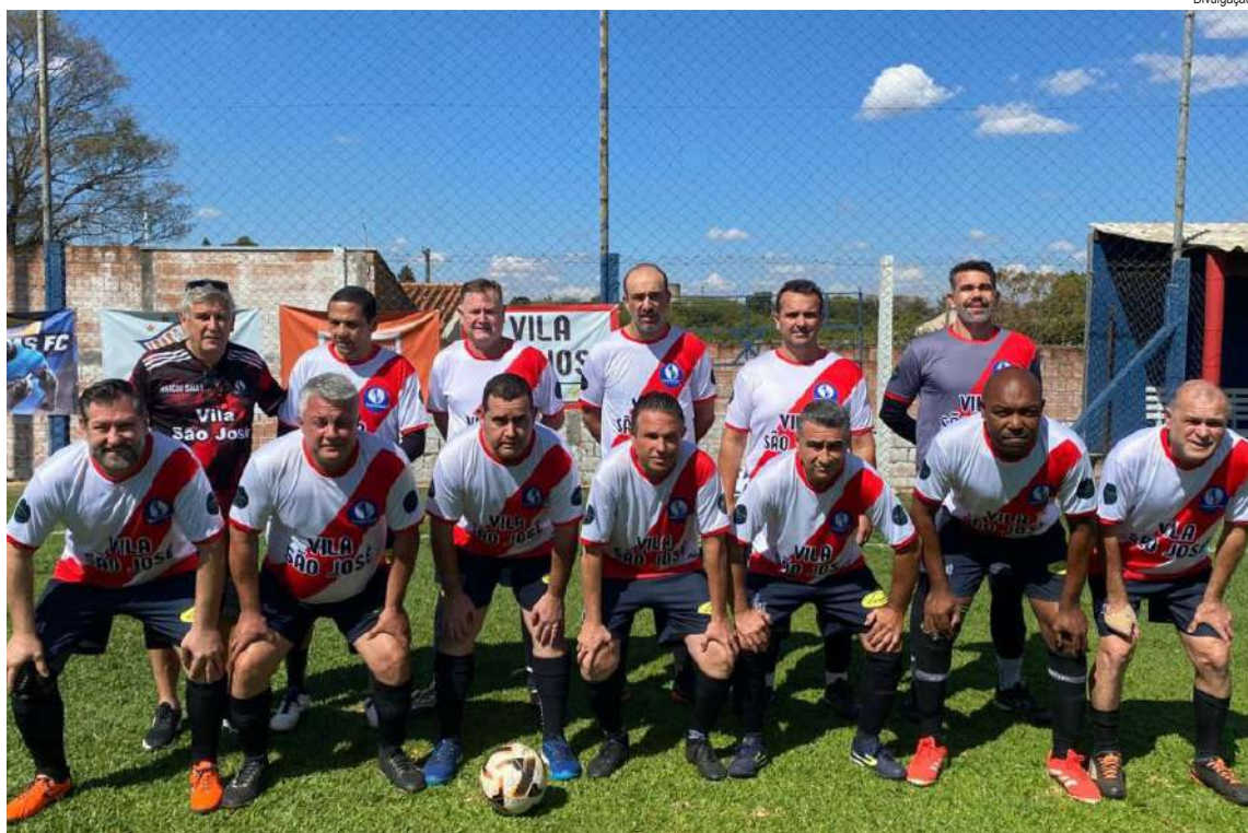
Vila São José segue vivo no Master e está na semifinal

Quartas de final tiveram disputas acirradas