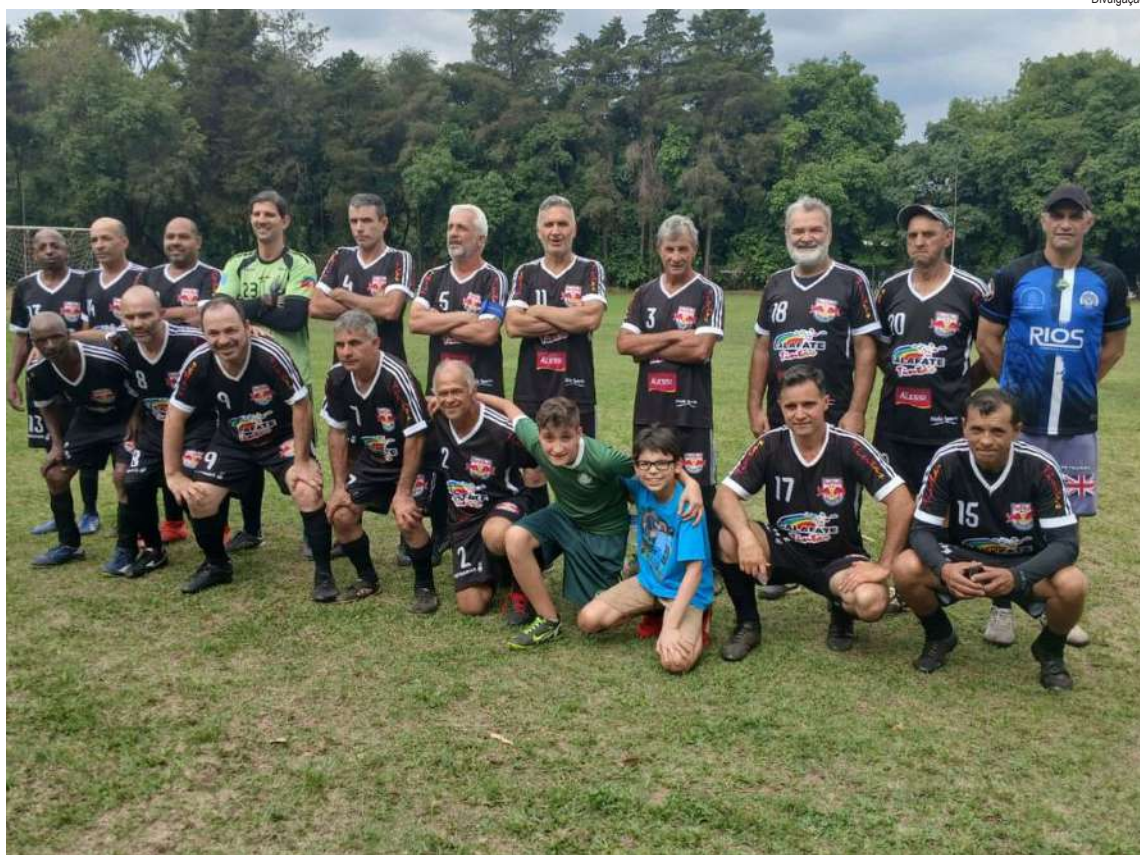
São João Batista garantiu presença nas quartas de final

Agora, a fase eliminatória promete ser eletrizante. Rivalidade histórica, clima quente, jogadas duras e a corrida pelo título ganham um novo capítulo. O Master segue vivo — e só os fortes continuam na briga.