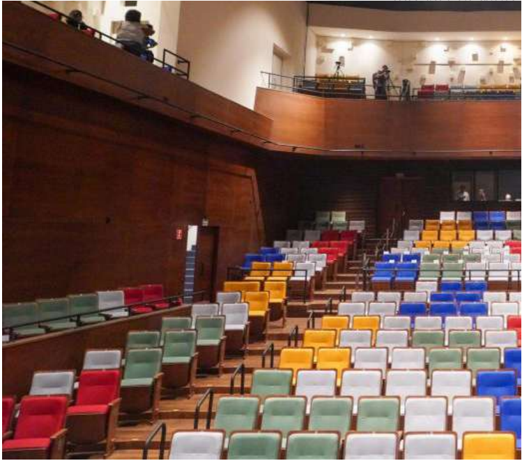
Celso Silva/Governo do Estado de SP