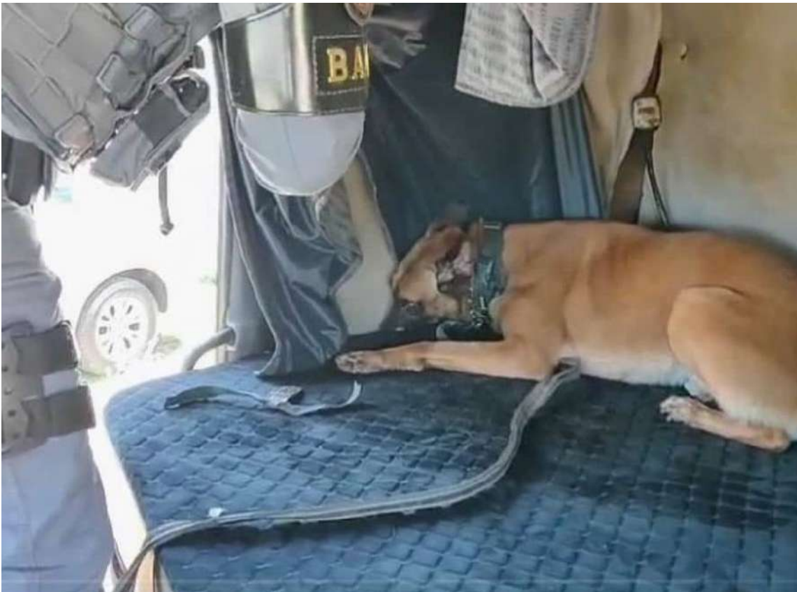
A equipe abriu o local indicado e encontrou oito fardos de entorpecentes, que totalizaram 102 quilos

foi preso em flagrante. A Polícia Militar Rodoviária realizava fiscalização na região, com apoio do Canil, quando abordou um caminhão com placas do Paraguai. No veículo, com carga de arroz a granel, um cão indicou que havia drogas escondidas. A equipe abriu o local indicado e encontrou oito fardos de entorpecentes, que totalizaram 102 quilos. Com o suspeito ainda foram apreendidos um celular e mais de R$ 6,5 mil em espécie. Ele foi conduzido por policiais do 2º Batalhão de Polícia Militar Rodoviária à Delegacia Federal do município, onde permaneceu à disposição da Justiça.