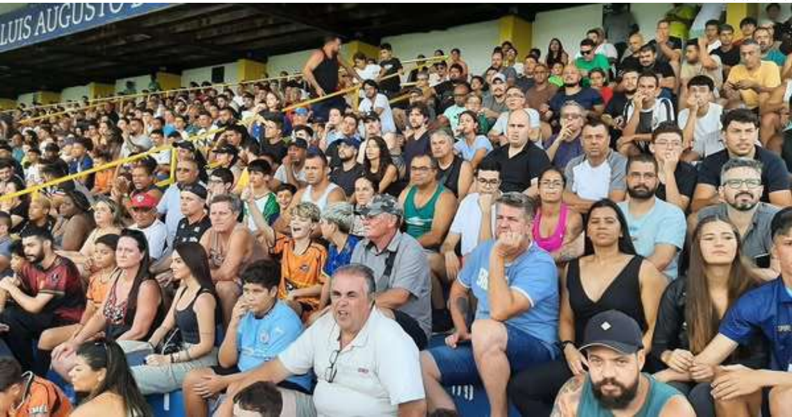
Estádio Luisão será palco dos jogos da sede São Carlos, que terá como atração o Santos