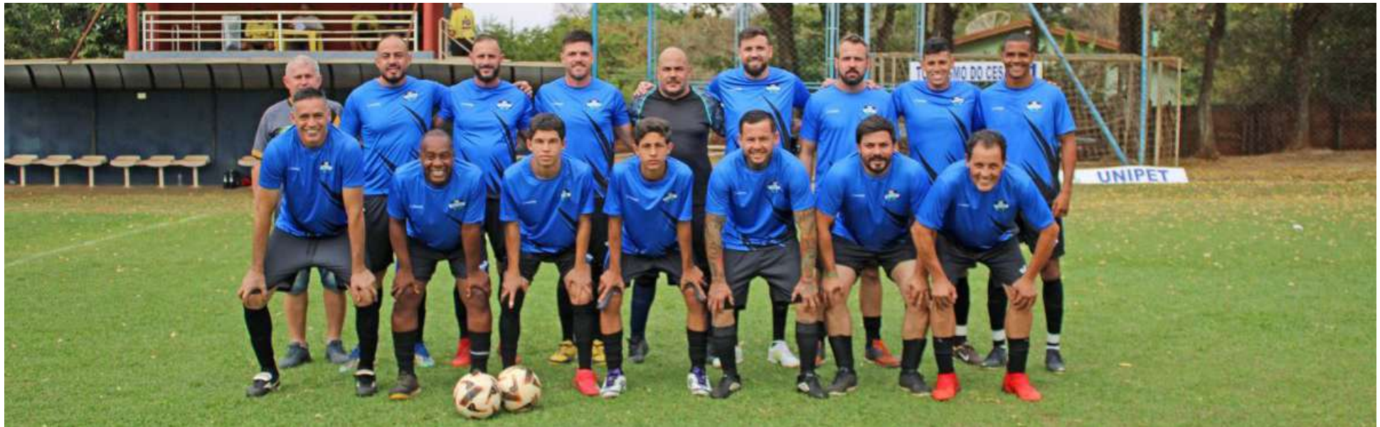
Unipet goleou e disputa a final do Country

As semifinais do 46º Campeonato Interno do São Carlos Country Club incendiaram o fim de semana e deixaram claro que ninguém chegaria à final sem muita luta — e emoção não faltou.