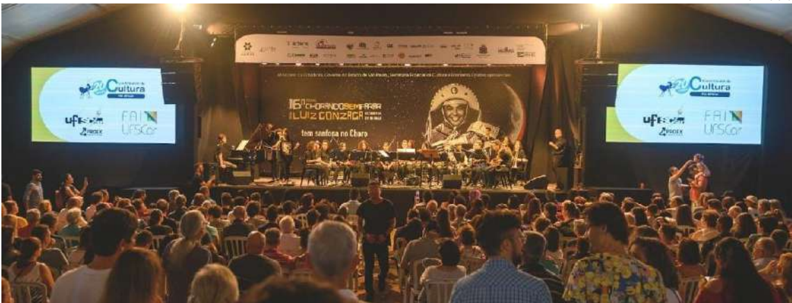
Festival Internacional de Música Instrumental ChorandoSemParar, na Praça XV: programação de 12 horas consecutivas de apresentações acontece no próximo domingo (7), das 10h às 22h

Maratona musical, que deu origem ao nome do Festival, reúne atrações nacionais e internacionais em São Carlos; domingo (7) terá 12 horas de apresentações na Praça XV